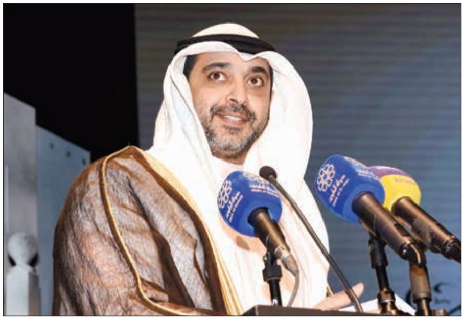
الشيخ محمد عبدالله ممثل سمو رئيس الوزراء يلقي كلمته