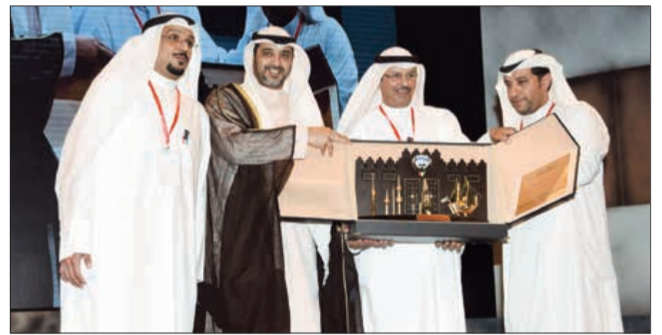
تكريم وزير الدولة لشؤون مجلس الوزراء ووزير الإعلام بالوكالة الشيخ محمد عبدالله

ومدن المعمورة وكان هاجسه الأساسي المساهمة في تقديم مسرح يليق بالإنسان ويرتقي به. وقال إن دور الراحل الشطي تجاوز ذلك إلى بصمات: «نفتخر ونعتز بها ومنها دعم إنشاء المعهد العالي للفنون المسرحية وهو أحد الصروح الشامخة التي أثرت حياتنا المسرحية ليس فقط في الكويت بل في دول مجلس التعاون الخليجي الست».