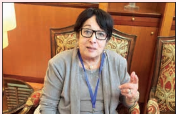
الفنانة القديرة سميرة عبدالعزیز

فقام بتحضير عرض لي بعنوان «مخدة الكحل» الذي قدم في عام 2004، واستقبله الجمهور والفنانين بحفاوة وإشادة كبيرة، لذا يعد الشطي قيمة مسرحية عربية عالية». كما تطرقت عبدالعزیز إلى إطلاق دورة تحمل اسم الفنان الراحل فؤاد الشطي فقالت «الشطي فنان مسرحي كبير يستحق كل التقدير والتكريم، وجميل أن تكون هناك دورة باسمه وتستمر في السنوات القادمة، كونه يمثل تحفيز للشباب والأجيال الجديدة للمسرح، فالاحتفاء والتكريم والتخليد لهذه الشخصية الرائدة تكريماً للمسرحيين العرب جميعاً، فهو إنسان مثقف مطلع ومتابع للحركة المسرحية جيداً، وأعجبتني الفيلم الوثائقي الذي أبرز بصمات الراحل الشطي عبر مسيرته الطويلة وتاريخه الأخر منذ بدايته وسفره وتعلمه وحياته ورأي الناس فيه والقريبين منه».