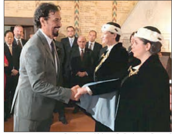
السفير الشيخ علي الخالد مشاركاً في مراسم التنصيب

سان مارينو - كونا: شارك سفيرنا لدى إيطاليا المحال إلى جمهورية سان مارينو الشيخ علي الخالد في حفل تنصيب رئيسي الدولة المنتخبين في الجمهورية ميمو زافولي وفانيسا دامروسو. وكرت السفارة في بيان ان السفير الخالد رفع إلى رئيسي الجمهورية نهائي صاحب السمو وسمو ولي العهد مع التمنيات لها بالتوفيق والنجاح ولشعب سان مارينو الصديق بزميد من الازدهار. وأكد الخالد للحاكمين الجديدتين حرص الكويت وحكومتها على تنمية علاقات الصداقة مع جمهورية سان مارينو وتعزيز أواصر التعاون المتبادل على مختلف الأصعدة.