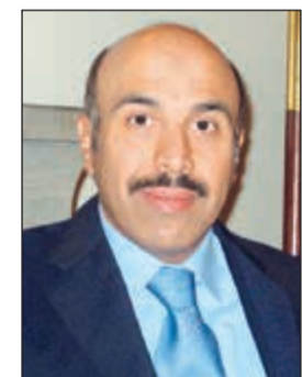
السفير سامي السليمان

المطلوبة من أجل تشجيع ابنائنا الطلبة الدارسين في فرنسا على المفاخرة والاجتهاد في التحصيل العلمي وصولاً الى تقوية معارفهم وتعزيز قدراتهم ومن ثم تحقيق أقصى درجات التفوق والنجاح للعودة الى بلادهم وهم على اتم الاستعداد للمساهمة في خدمة وتقدم مجتمعهم. وقدّم السليمان نصائحه للوفد الطلابي الزائر بأن يكونوا خير سفراء لوطنهم وأن يساهموا بفاعلية وبروح