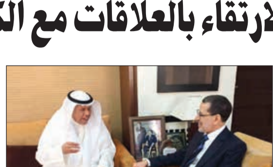
سعد الدين العثماني والسفير عبد اللطيف الجحيا

لتأخر انعقاد اللجنة العليا المشتركة بين البلدين بسبب تأخر تشكيل الحكومة المغربية. من جانبه، قال السفير الجحيا إن اللقاء تناول العلاقات الثنائية المتميزة القائمة بين البلدين وبحث سبل وإمكانيات دعمها وتعزيزها خاصة في ظل الحكومة الجديدة. وأعرب الجحيا لرئيس الحكومة المغربية عن تهنئته بالثقة التي حظي بها من جانب العاهل المغربي بتعيينه رئيسا للحكومة، مؤكدا حرص القيادة السياسية على تطوير العلاقات القائمة بين البلدين.