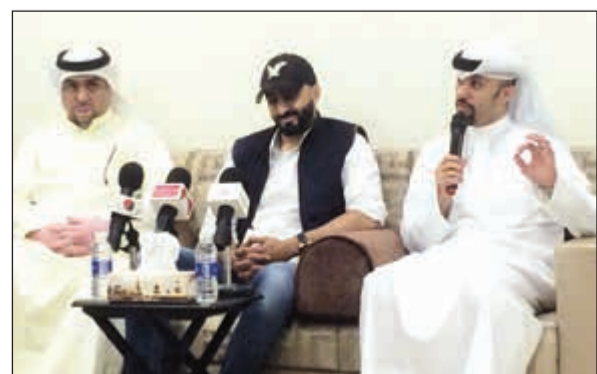
المخرج يوسف البقشي في الندوة

الهدف منه المشاركة في المهرجانات فقط وليس الحصول على الجوائز. وأضاف اجتزت عدة صعاب في عمل الفيلم شعرت خلالها بالمتعة، أبرزها تنوع الشخصيات، كما ان اللقطة الواحدة في الفيلم استغرق عملها نحو أسبوعين، مع العلم انه كان هناك وقت محدد لعمل الفيلم والمشاركة في مهرجان دبي، موضحا انه كان يعمل نحو 7 ساعات يوميا. وأشار إلى أنه تدارك بعض الأخطاء ورصد الملاحظات على فيلم «سندره» ليأتي بعد ذلك فيلم «نقلة»، وهو يتحدث عن