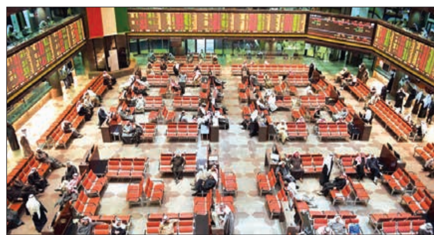
مؤشرات البورصة الوزني والكويت 15 تخالفان الاتجاه

5,2 ملايين دينار حيث اتجهت المؤسسات الخليجية والأفراد إلى البيع بقيمة 4,8 ملايين دينار ومليون دينار على التوالي. وتوجه الأجانب إلى شراء حيث سجلت المؤسسات الأجنبية صفقات شراء بقيمة 12,5 مليون دينار حيث سجلوا صفقات شراء بقيمة 23 مليون دينار وبيع بقيمة 10,3 ملايين دينار. كما اتجهت الصناديق الأجنبية إلى شراء مسجلين صفقات شراء بقيمة مليوني دينار، فيما اتجه الأفراد إلى البيع بعد تسجيلهم مشتريات بقيمة 21,7 مليون دينار وبيع بقيمة 23,4 مليون دينار. وخلال مارس، ارتفع المؤشر السعري للبورصة 3,6٪ خلال مارس الجاري، بينما تراجع الوزني وكونيت 15 بنسبة 2,5٪ و3,13٪ على الترتيب.