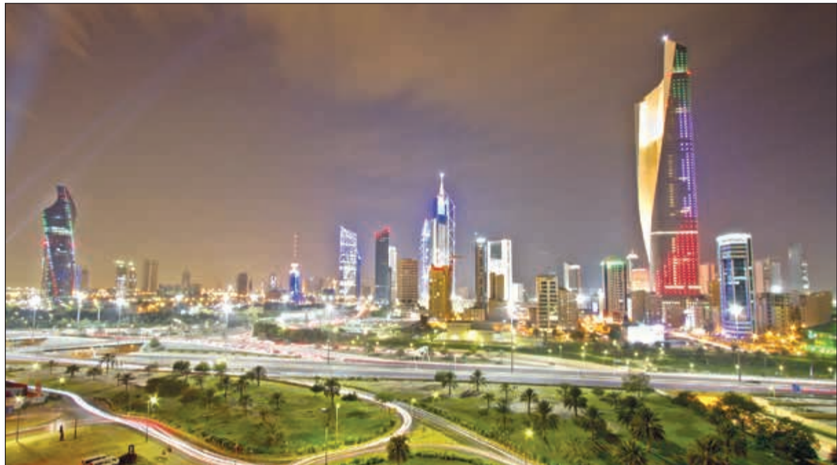
الكويت في وضعية أفضل لسعر التعادل في الميزانية بين نظرائها منتجي النفط

وقال التقرير إن قدرة هذه الدول المصدرة في المحافظة على استجابة سياساتهم تجاه هذه المتغيرات ليست واضحة على الدوام، فسي ظل تباطؤ الانضباط المالي إلى حد ما في أعقاب تعافي أسعار النفط، وما نجم عنه من تحسن أسعار نقطة التعادل المالية في دول التعاون بشكل تلقائي من انخفاض تكلفة توليد الكهرباء وتقليص فواتير دعم الوقود والخدمات.