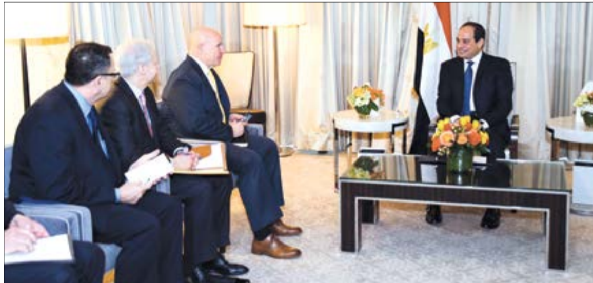
الرئيس عبد الفتاح السيسي مستقبلا مستشار الأمن القومي الأمريكي هيربرت ماكاستر

قال وزير الأمن الداخلي الأمريكي السابق مايكل شيرتوف إن زيارة السيسي ومباحثاته مع ترامب تشكل فرصة مواتية للبلدين للعمل معا لتعزيز أمن واستقرار منطقة الشرق الأوسط، واصفا مصر بأنها دولة ذات دور محوري في المنطقة، وأن الوقت مناسب تماما لدمج العلاقات الاستراتيجية بين البلدين على جميع المستويات.