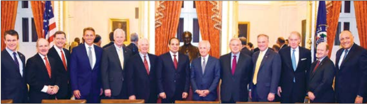
لقطة جماعية للرئيس عبد الفتاح السيسي مع قيادات وأعضاء ولجان مجلسي الشيوخ والنواب بالكونغرس