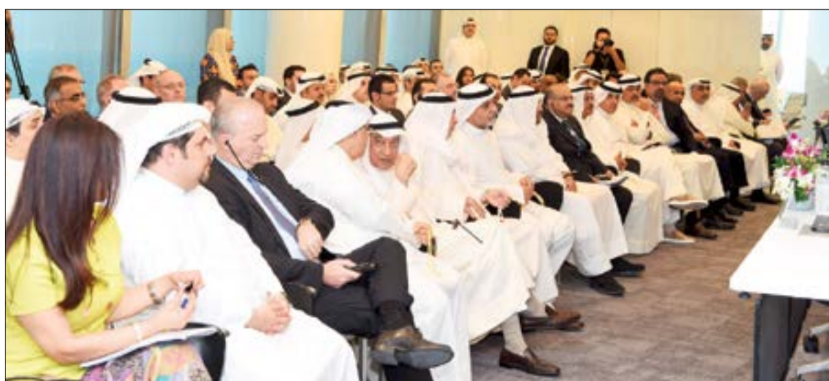
رؤساء الشركات والبنوك التابعة لشركة «كيبكو» في مقامة الحضور

ذكر العيار أن 2016 شهد انطلاق أعمال تطوير البنية التحتية في مشروع ضاحية حصة المبارك الذي يعتبر أحد أكبر المشاريع العقارية في الكويت، وستعمل الشركة على تطوير 45-40% من المشروع على أن يتم بيع القسائم المتبقية للمطورين الذين يشاركون رؤية شركة المشاريع لهذه الضاحية المتكاملة والمتعددة الاستخدامات. وتوقع العيار أن يتم الانتهاء من أعمال البنية التحتية والطرق والزرعات بالمشروع