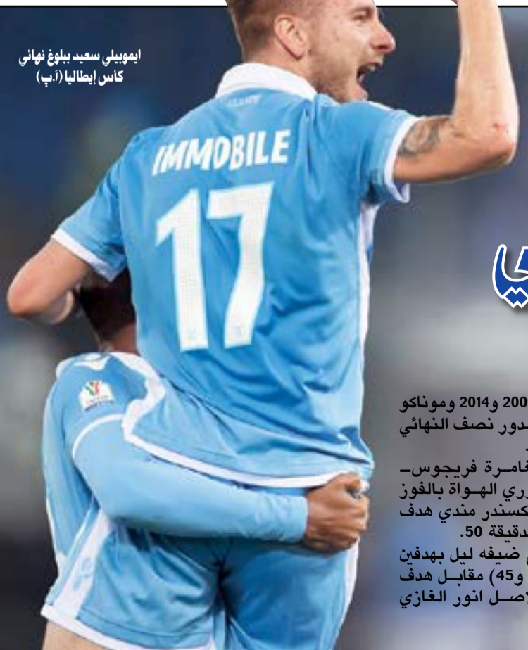
إيموبيلي سعيد ببلوغ نهائي كأس إيطاليا