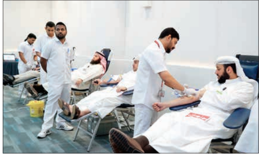
موظفو زين يتبرعون بالدم

تظمت زين- الشركة الرائدة في تقديم خدمات الاتصالات المتنقلة في الكويت- حملة التبرع بالدم الأولى لموظفيها هذا العام، وذلك استمراراً لتعاونها الاستراتيجي مع بنك الدم المركزي الذي استضافته في مقرها الرئيسي في الشويخ.