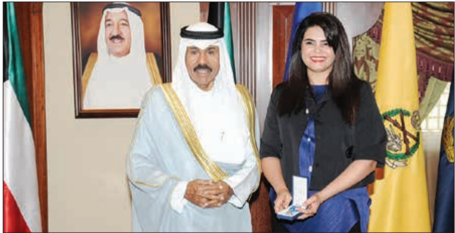
سمو ولي العهد الشيخ نواف الأحمد مستقبلاً د.العنود الشارخ