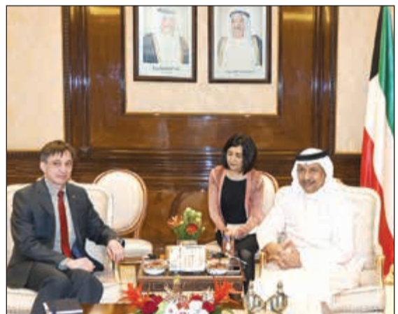
سمو الشيخ جابر المبارك لدى استقباله سفير النمسا