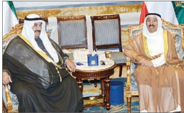
صاحب السمو الأمير لدى استقباله سمو الشيخ ناصر المحمد