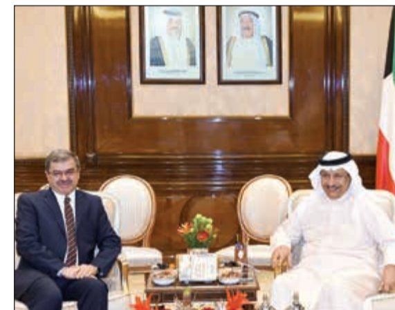
سمو رئيس الوزراء الشيخ جابر المبارك مستقبلاً السفير العراقي

استقبل سمو رئيس الوزراء الشيخ جابر المبارك في قصر بيان أمس كلا من سفير جمهورية النمسا الصديقة لدى البلاد د.زيغورد باخر وسفير جمهورية العراق الشقيق لدى البلاد علاء الهاشمي وسفير جمهورية بلغاريا الصديقة لدى البلاد يوريس جينادييف يوريسوف وذلك بمناسبة تسلم مهام عملهم. وحضر المقابلة رئيس ديوان سمو رئيس مجلس الوزراء الشيخة اعتماد الخالد.