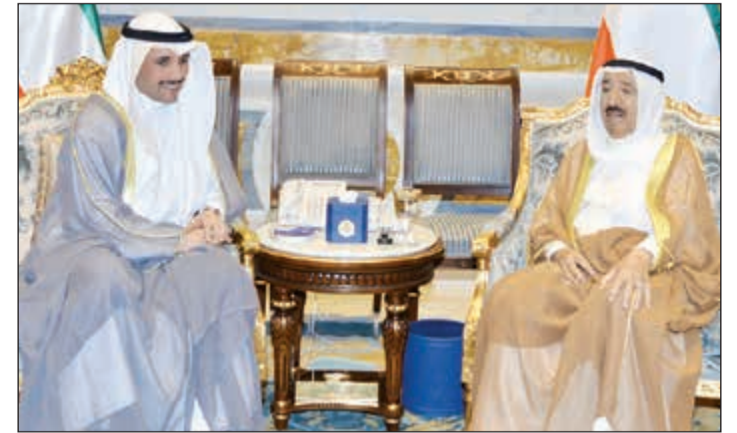
صاحب السمو الأمير الشيخ صباح الأحمد مستقبلاً مرزوق الغانم