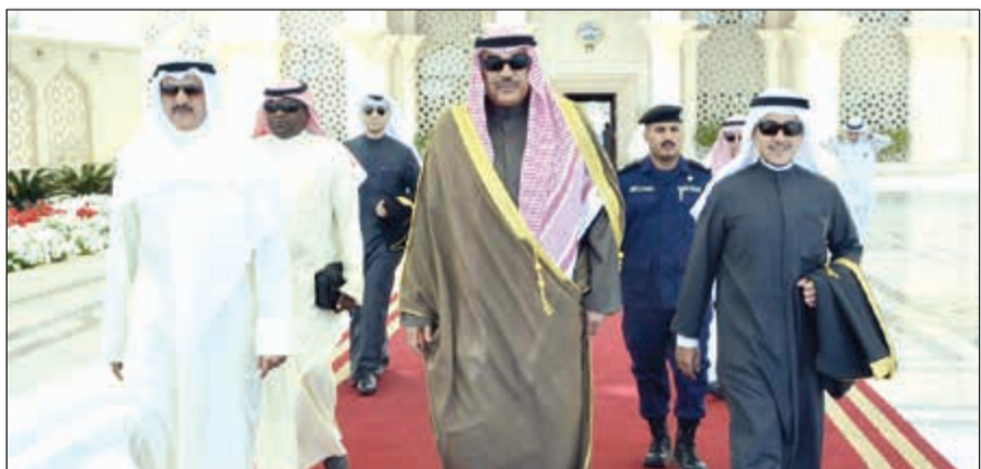
الشيخ صباح الخالد مغادراً البلاد إلى بروكسل

سياسي شامل ودائم للأزمة السورية، إضافة إلى تسليط الضوء على عمليات الإنعاش المبكر والمصالحة وبناء السلام والتخطيط إلى ما بعد انتهاء الصراع. ويضم وفد الكويت المشارك كلا من مساعد وزير الخارجية لشؤون مكتب النائب الأول لرئيس مجلس الوزراء ووزير الخارجية السفير الشيخ د.أحمد ناصر المحمد، ونائب مساعد وزير الخارجية لشؤون المنظمات الدولية ناصر الهين، وسفير الكويت لدى مملكة بلجيكا الصديقة جاسم البديوي ورئيس بعثتها لدى الاتحاد الأوروبي ولدى حلف شمال الأطلسي. كما سيجري المؤتمر الذي سيشترك فيه أكثر من سبعين دولة ومنظمة مجتمع مدني تقييماً للتقدم المحرز منذ مؤتمر لندن الرابع للمناحزين لمساعدة سورية والمنطقة الذي عقد في فبراير من العام الماضي وبحيث أنتج السبل لإيجاد حل