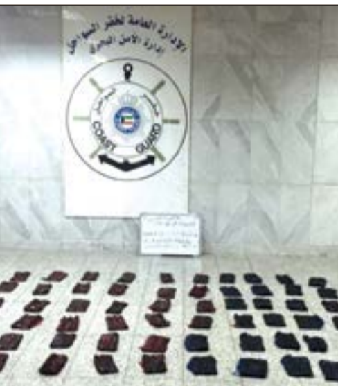
المضيوبات التي ضبطت بحوزة المواطن الخليجي

أحبط رجال إدارة الأمن البحري بالإدارة العامة لخفر السواحل محاولة تهريب مواد مخدرة وإدخالها للبلاد عن طريق البحر. كانت معلومات قد وصلت إلى إدارة الأمن البحري عن قيام مجموعة من الأشخاص بالاتفاق على تهريب مواد مخدرة إلى الكويت عن طريق البحر بقصد الاتجار، وعليه تم تكثيف التحريات وجمع المعلومات والاستدلالات التي أكدت صحة المعلومة، وبعد اتخاذ كل الإجراءات القانونية تم رصد المتهمين، أحدهما مواطن والآخر خليجي، وقبض عليهما بعد مطاردة بحرية انتهت بضبطهما، وعثر بحوزتهما على حقيبة بداخلها 60 قطعة يشتبه في أنها مخدرة. وأحيل المتهمان والمضيوبات إلى الجهة المختصة لاتخاذ الإجراءات القانونية.