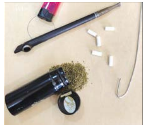
المواد المخدرة التي حاول وكيل الضابط إدخالها إلى النزلاء