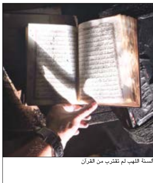
أسنة الذهب لم تقترب من القرآن

الاختصاص. فواتير من محل صالون من جهة أخرى، ابلغ وافد مصري بوصفه موكلا عن صالون نسائي بتعرضه لخيانة أمانة وسرقة 900 دينار ودفتر