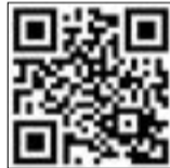
شاهد الفيديو على موقع الانباء

وحول المشاريع التي يقوم بها قطاع الصرف الصحي بالوزارة لفت إلى أن هناك تنسيقاً مع شركة نفط الكويت للاستفادة من المياه شديدة الملوحة في الحقول الشمالية والجنوبية البلاد مشيراً إلى دراسة وتصميم وتنفيذ المحطة المركزية لمعالجة الحمأة في محطة (كبد) لاستغلالها في إنتاج الطاقة مع هيئة الشراكة بالإضافة إلى مشروع الخدمات العامة الطوارئ وحماية البيئة المتوقع توقيع عقود نهاية شهر مايو. وبين أن برنامج تجديد شبكات الصرف الصحي والبنية التحتية والتي تتضمن 7 مشاريع منها تجديد شبكة الصرف الصحي وأعمال البنية التحتية - المرحلة 12 بمنطقة الرقة وهدية ومشروع تجديد البنية التحتية وشبكة الصرف الصحي المرحلة 11 بمناطق السرة وقرطبة والبرموك وإن هناك 32 منطقة تجري دراستها والتصميم الخاص بها لتحسين البنية التحتية وأعمال تجديد شبكة الصرف الصحي بها وفق الاستراتيجية حتى العام 2045.