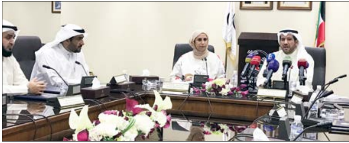
الشيخ عبدالله الأحمد وم. عواطف الغنيم خلال المؤتمر الصحافي

وعن مشروع الأنفاق العميقة لفتت إلى أن الوزارة وضعت هدفاً استراتيجياً لإنشاء نظام جديد للمشروع وفقاً لأحدث المعايير العالمية بهدف حماية