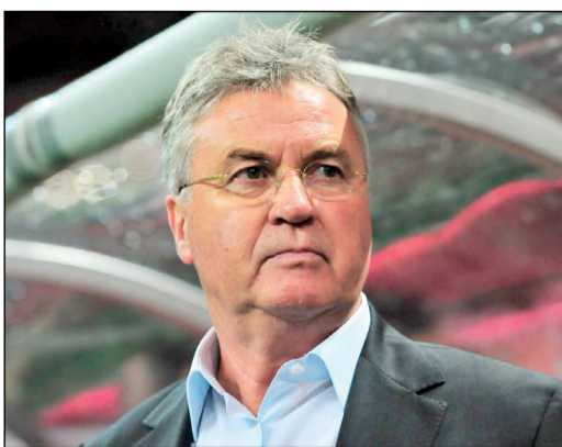
الهولندي غوس هيدنيك

كشف المدرب الهولندي غوس هيدنيك أمس انه رفض تدريب لистер سيتي بطل الدوري الإنجليزي لكرة القدم الموسم الماضي، بعد اقالة الإيطالي كلاوديو رانييري، وأوصى بتعيين مساعده كريغ شكسبير. وقال المخضرم هيدنيك (70 عاما) لصحيفة «صندي تايمز» الإنجليزية: «بصراحة لم تكن ثمة محادثات مباشرة مع لистер، لكنكم تعرفون الطرق التي تسلكها مثل هذه الأمور، مثلاً (أنهم يفكرون بك)». وأوضح لقدم سالوا ليس بشكل مباشر (...) وأنا رفضت. إذا قررتم اقالة رانييري، فلماذا لا تجربون مساعده؟». وقال هيدنيك: «شكسبير يعرف النادي ويعرف اللاعبين (...) قلت لهم لماذا لا تجربوه وترون ماذا سيحصل؟». وأضاف «لحسن الحظ كنت مصيبا في ما ذهبت إليه».