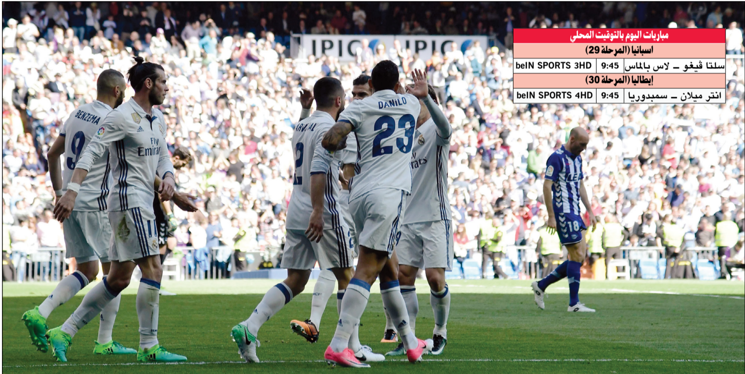
كتيبة الرعب الملكي