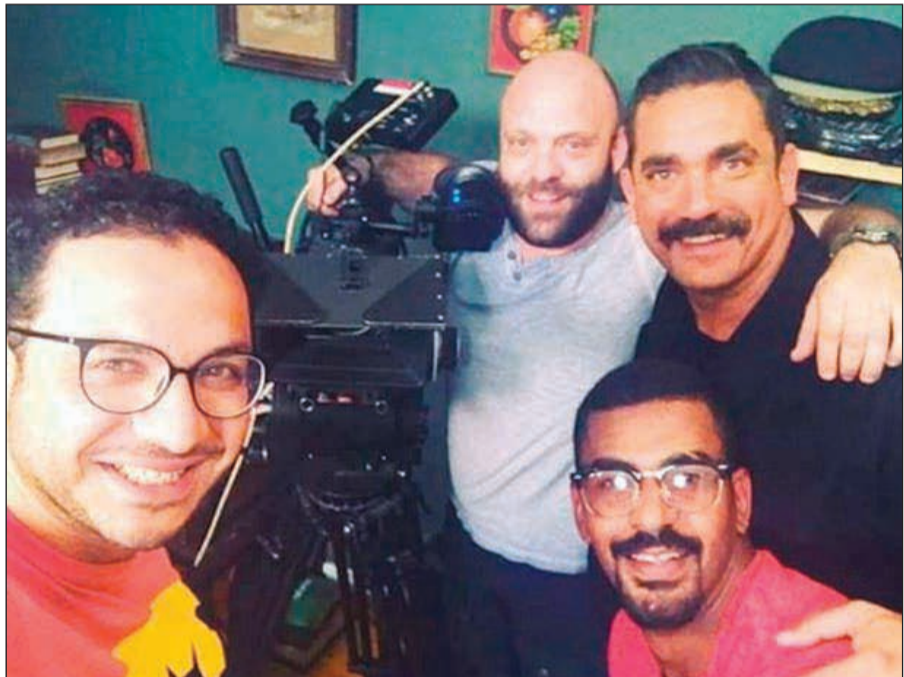
من كواليس «كلبش» مع المخرج بيتر ميمي

عثمان أبو لبن، وبطولة مصطفى فهمي، وخالد سليم ونيكول سابا، إلا أنها لم تحقق النجاح المطلوب.