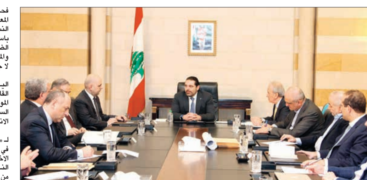
سعد الحريري يترأس اجتماعاً للبحث في سياسة الحكومة بشأن ملف الناخبين السوريين تمهيدا لعرضها في مؤتمر «بروكسل للناخبين» الأربعاء المقبل

فتحتي أصحاب القانون او المعنيون به، ملوا معادلة النسبي والأكثري وقانون باسيل الأرفونكسي والدوائر الضيقة والواسعة والمنفرد والمختلط، لكن في النهاية، لا جواب. عملياً بعد اسبوعين من اليوم، تدخل في التوقيت القاتل على صعيد القانون الموعود، ومع ذلك فإن الجدل السياسي مستمر حول القانون الانتخابي. وتحدثت مصادر معنية لـ «الأنباء» عن مخرج ممكن في حال وصلنا إلى الأسبوع الأخير من العقد العادي لمجلس النواب في الأسبوع الثالث من مايو المقبل، ويتمثل في تصويت الهيئة العامة لمجلس النواب على مجمل القوانين الموجودة في ادراج المجلس، لأن إجراء الانتخابات وفقاً لأي قانون يحظى بأغلبية الأصوات النيابية، أفضل من ترك الفراغ يرحف إلى اروقعة السلطة التشريعية، الأمر الذي تعتبره أمل وحزب الله، خطأ احمر، كما باقي القوى الحزبية والطائفية. إلى ذلك، قال رئيس الحكومة السابق نجيب مقياتي: إذا قرر حزب الله مقاطعتي فهذا شأنه. وأضاف: إذا عمل الحزب في مقاومة إسرائيل فانا معه على العميان، اما في المسائل الأخرى فإن الأمر يخضع للوثاب الوطنية. مقياتي كان يعلق على معلومات حول عزم حزب الله مقاطعته لأنه وقع مذكرة الرؤساء الخمسة السابقين إلى القمة العربية، ونفي مقياتي أن تكون غاية المذكرة استهداف رئيس الجمهورية ويتساءل كيف نستهدف ثم نرسل نسخة عن المذكرة له ولرئيسي مجلس النواب والحكومة.