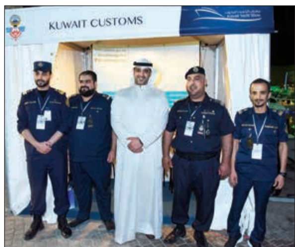
.. ومع فريق الجمارك