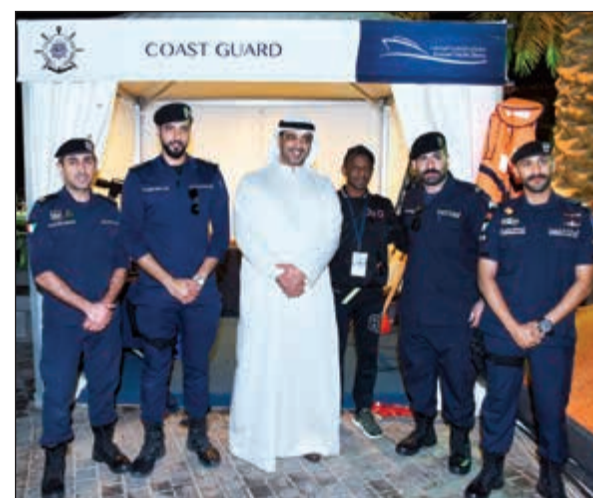
العبدالله في لقطة تذكارية مع فريق خفر السواحل