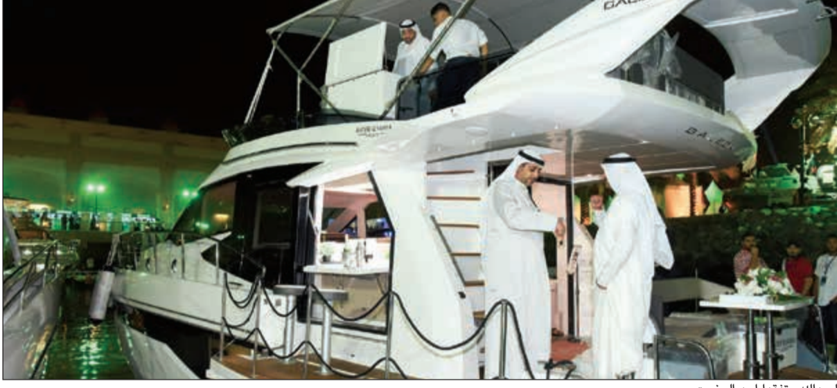
العدالله متفقدا احد اليخوت