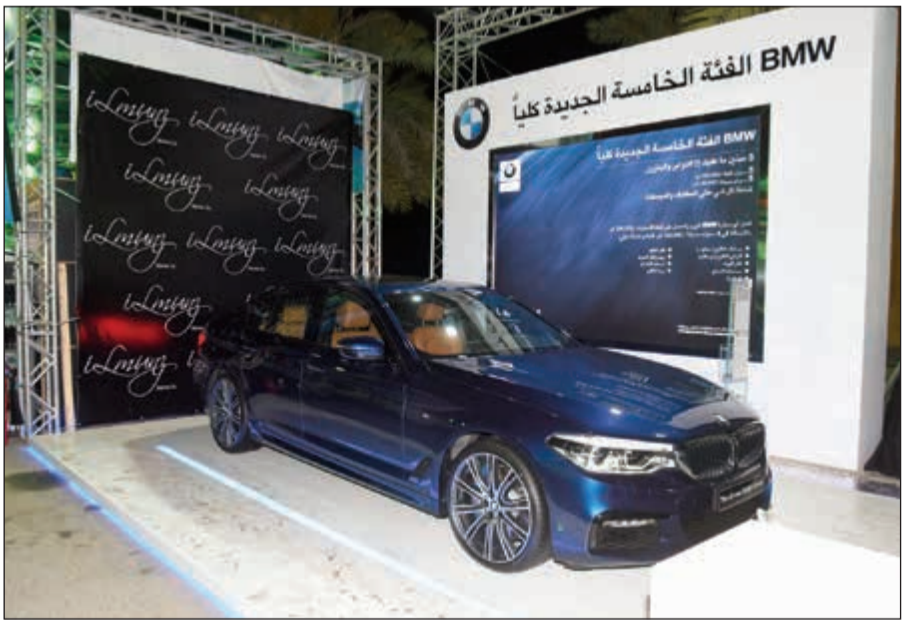
جناح شركة علي الغانم وأولاده للسيارات الراعي الذهبي للمعرض