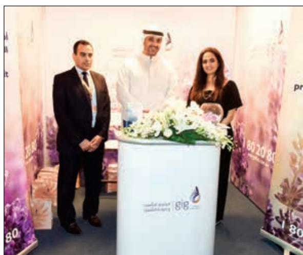
.. وداخل جناح «الخليج للتأمين»