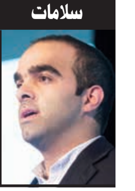
سلامات د. يوسف أحمد شمس الدين المملكة المتحدة دكتوراه في علم الأدوية -