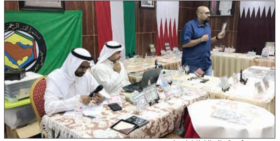
عرض مجموعة من العملات أثناء المزاد لبيعها

جميع العملات عادة ما تكون قديمة وأصلية وينطبق عليها كل الشروط لبيعها إضافة إلى ما هو مطبوع، حيث يتم التنويه للمشاركين في المزاد بذلك.