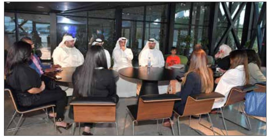
اللجنة العليا لمبادرة «كافأ» خلال إجراء السحب على الجائزة الأولى للمسابقة الترويجية