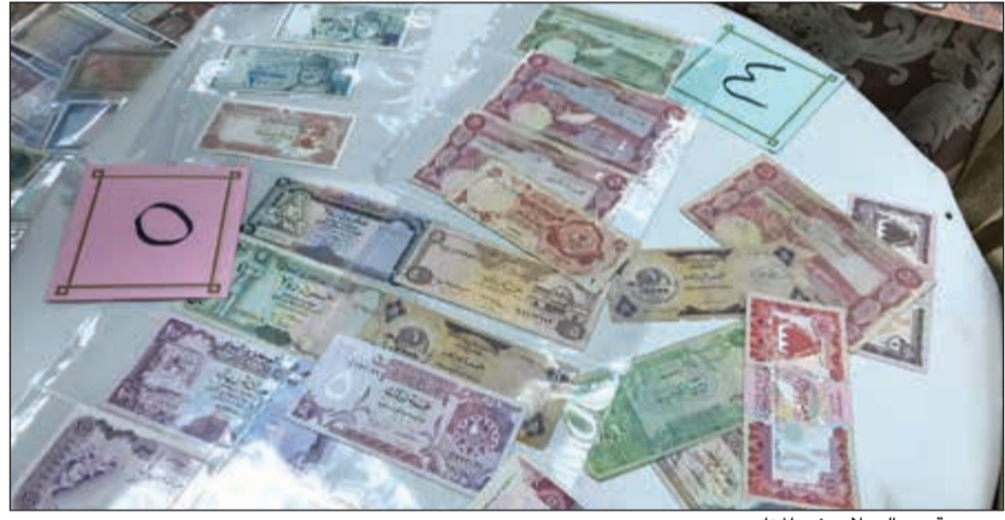
مجموعة من العملات في المزاد