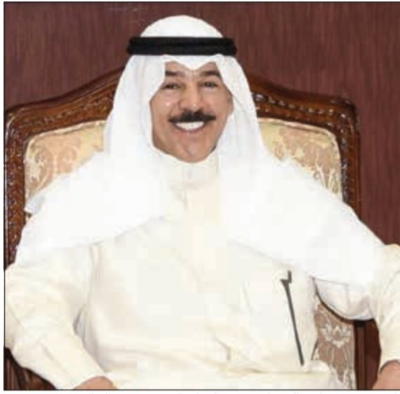
نائب رئيس مجلس الوزراء ووزير الدفاع الشيخ محمد الخالد

الإسراء أو الفقد «ليس على رأس العمل حالياً»، أبناء العسكريين المشاركين في حرب تحرير الكويت، أبناء العسكريين المشاركين في الحروب العربية «من على رأس عمله»، ومن ليس على رأس عمله»، أبناء العسكريين غير المشاركين في الحروب «على رأس عمله خدمة 30 سنة فعلية»، أبناء العسكريين المنتهية خدمتهم قبل 2 أغسطس 1990، وحملة إحصاء 1965.