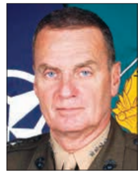
الجنرال جيمس جونز

وتكتيكات مشتركة، عندها يخيّل إلى أن الولايات المتحدة سترحب بالعمل مع هذا النوع من الكيان. ولم يستبعد الجنرال جونز انضمام الولايات المتحدة إلى هذا الحلف. وحول رؤيته لمستقبل العلاقات الأميركية - السعودية بعد لقاء الأمير محمد بن سلمان ولي العهد السعودي والرئيس ونالد ترمب، أجاب جونز: قطعنا خطوة كبيرة في هذا اللقاء، وكل الذين التقيتهم في واشنطن، وعددهم كبير، كانوا سعداء لمراقبتهم التفهم الواضح والشعور الجيد الذين خرجوا من اللقاء، وكلنا أمل