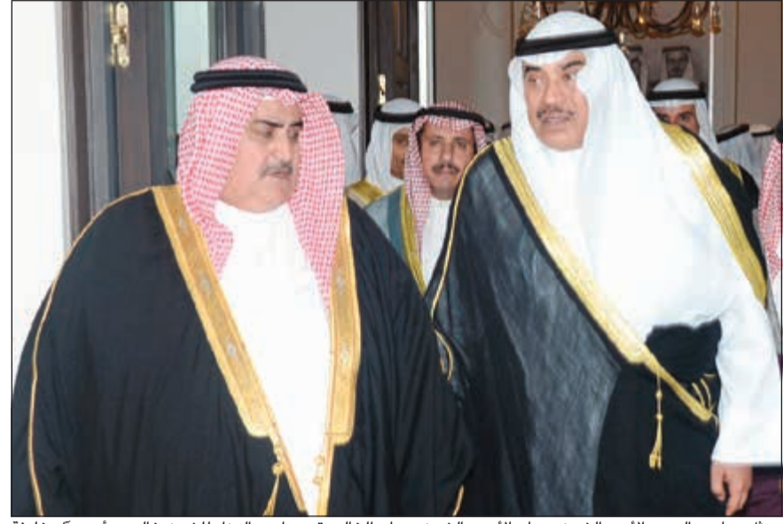
ممثل صاحب السمو الأمير الشيخ صباح الأحمد الشيخ صباح الخالد يقدم واجب العزاء للشيخ خالد بن أحمد آل خليفة

قام ممثل صاحب السمو الأمير الشيخ صباح الأحمد، النائب الأول لرئيس مجلس الوزراء ووزير الخارجية الشيخ صباح الخالد عصر أمس بتقديم واجب العزاء إلى الشيخ خالد بن أحمد آل خليفة وزير خارجية مملكة البحرين الشقيقة والأسرة آل خليفة الكرام حيث نقل تعازي صاحب السمو الأمير الشيخ صباح الأحمد، وسمو ولي العهد الشيخ نواف الأحمد، وشعب الكويت بوفاة المغفور لها بإذن الله تعالى الشيخة شيخة بنت محمد بن عيسى آل خليفة أرملة المغفور له بإذن الله تعالى الشيخ أحمد بن محمد آل خليفة طيب الله ثراها وجعل الجنة منواها وذلك في مدينة الرفاع الغربي بالعاصمة المنامة. وكان ممثل صاحب السمو الأمير قد غادر البلاد عصر