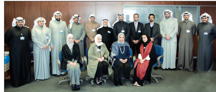
لقطة جماعية للمشاركين بالدورة

وآليات التعامل في أسواق المال المعاصرة ومهارات كشف التلاعب في عمليات البورصة. وأضاف: «إن هذه الدورة تقع ضمن سلسلة من البرامج المتكاملة في المصرفية الإسلامية التي يتم تنفيذها على مراحل وفق خطة منهجية مراعية للمتطلبات التي تقتضيها تخصصات كل إدارة، وذلك انطلاقاً من سياسة الدولي بأن التدريب عملية مستمرة قد تتماشى مع التطور في الصناعة المصرفية الإسلامية، وهي السياسة المصاحبة لإقبال المتنامي على الخدمات المصرفية الإسلامية على الصعيد الدولي والإقليمي».