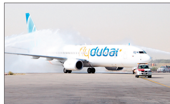
استقبال رحلة «فلاي دبي» الأولى في مطار الكويت الدولي عام 2010