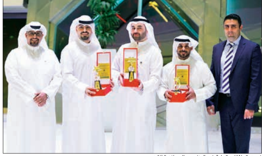
فريق العلاقات العامة في البنك مع الجوائز الثلاث

فاز بنك الكويت الوطني بثلاث جوائز من قبل جمعية العلاقات العامة الكويتية، وذلك في حفلها السنوي لجوائز العلاقات العامة وخدمة العملاء الذي نظمته مؤخرا تحت رعاية صاحب السمو الأمير الشيخ صباح الأحمد وحضور وزيرة الشؤون الاجتماعية والعمل ووزيرة الدولة للشؤون الاقتصادية هناد الصبيح في مركز الشيخ جابر الأحمد الثقافي.