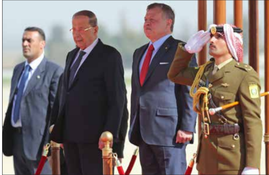
.. ومستقبلاً الرئيس اللبناني العماد ميشال عون

4 - ضرورة الإسراع في وضع استراتيجية متماسكة ومتعددة الأبعاد للاجتماعات الإرهاب من جذوره في المنطقة، ففي ضوء الضربات الموجعة التي تعرض لها تنظيم داعش في كل من سورية والعراق، تتورّ إشكالية سعي التنظيم إلى الظهور بواجهة جديدة على الساحات الدولية والعربية - استناداً إلى ما حققته حملاته الدعائية خلال الأعوام الماضية - مستنداً إلى بداعيته، بهدف الإبقاء على حالة الاضطراب والربح على الساحة الدولية، كما تشهد بذلك أحداث لندن الأخيرة، وكذلك الساحة الإقليمية التي قد لا تسلم من مثل هذه التحركات.