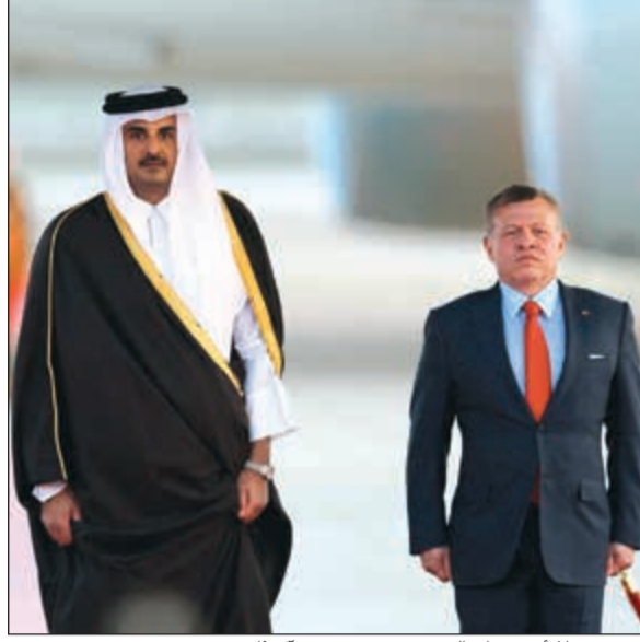
.. ومستقبلاً أمير قطر الشيخ تميم بن حمد آل ثاني