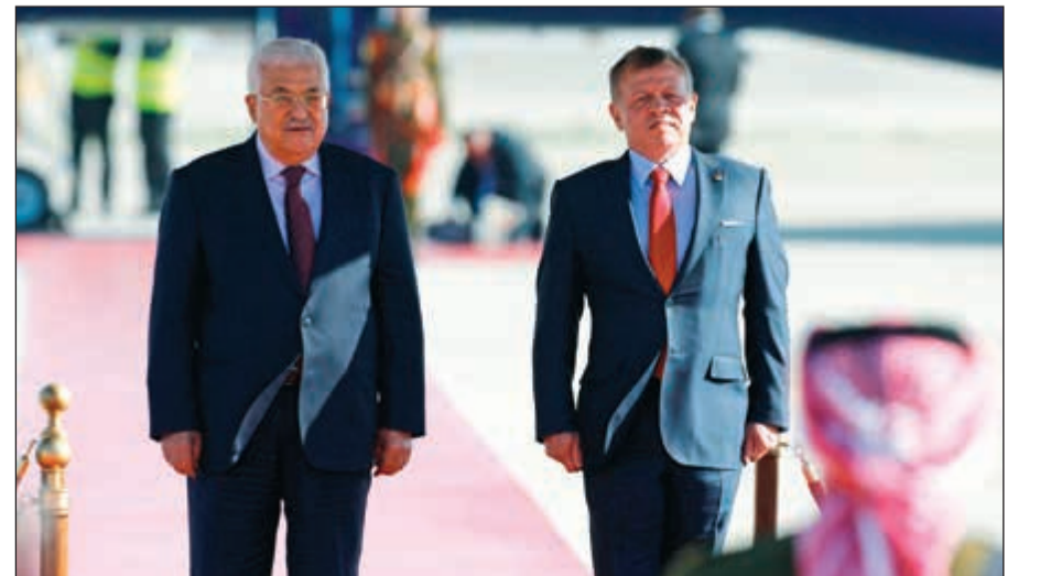
الملك عبدالله الثاني مستقبلاً الرئيس الفلسطيني محمود عباس