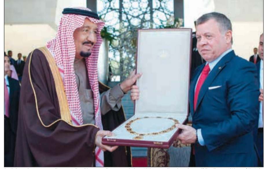
عاهل الأردن الملك عبدالله الثاني يقبل خادم الحرمين الملك سلمان بن عبدالعزيز «قلادة الشريف الحسين بن علي»