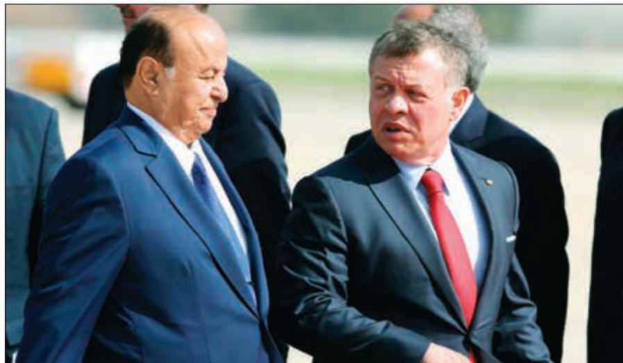
.. ومستقبلاً الرئيس اليمني عبدربه منصور هادي

وفيما يتعلق بالنتيجة التي ستخرج بها القمة حول صيانة الأمن القومي العربي ومكافحة الإرهاب، قال إن ملف الإرهاب يحظى بأولوية كبيرة لدى الجامعة العربية والدول الأعضاء، مؤكداً أن الإرهاب أصبح يضرب الجميع ولا بد من مكافحته واجتثاثه عبر منظومة متكاملة وشاملة. وعن أهم المشاركين في (قمة