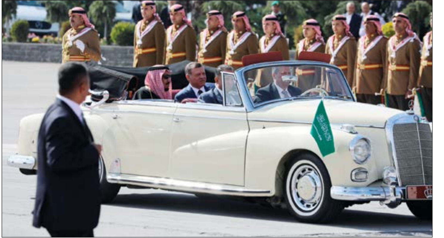
عاهل الأردن الملك عبدالله الثاني وخادم الحرمين الشريفين الملك سلمان بن عبدالعزيز يجلسان في سيارة ويستعرضان حراس الشرف في مطار عمان امس