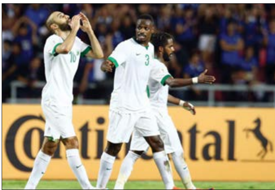
المنتخب السعودي قريب من التأهل لنهائيات كأس العالم

كما تستضيف أوزبكستان ضيفتها قطر في ذات المجموعة. وتنتج الإنظار إلى ملعب «أزادي» في طهران حيث تلحق إيران المتصدرة مع ضيفتها الصين. ويبحث المنتخب الإيراني عن الاقتراب خطوة إضافية من بلوغ النهائيات للمرة الثانية على التوالي والخامسة في تاريخه كونه يتصدر المجموعة برصيد 14 نقطة بفارق 4 نقاط عن كوريا الجنوبية الثانية. وتمتلك الصين 5 نقاط وتحتل مؤقتاً عن ذيل الترتيب لقطر (4 نقاط)، فيما رصيد أوزبكستان (9 نقاط) أمام سورية (8 نقاط). ويتأهل اول وفائي المجموعة مباشرة إلى روسيا، فيما يخوض صاحب المركز الثالث ملحقاً دولياً مع رابع اتحاد الكونكاف.