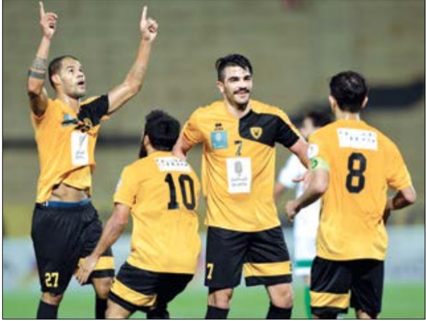
معنويات اللاعبين مرتفعة ويتطلعون لحسم لقب الدوري