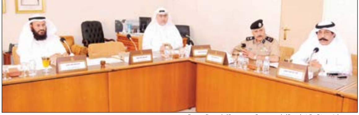
محمد هايف وخالد الشطي واللواء محمود الدوسري واللواء عبدالحميد العوضي

مخاطبة البلدية لتخصيص موقع لإنشاء سجن جديد، لافتا إلى أنه سيكون سحنا نموذجيا بمواصفات عالمية ويتضمن كل ما يتعلق برعاية السجناء سواء الرجال أو النساء أو الأحداث. وقال الدوسري في تصريح له بمجلس الأمة إن الاجتماع كان إيجابيا