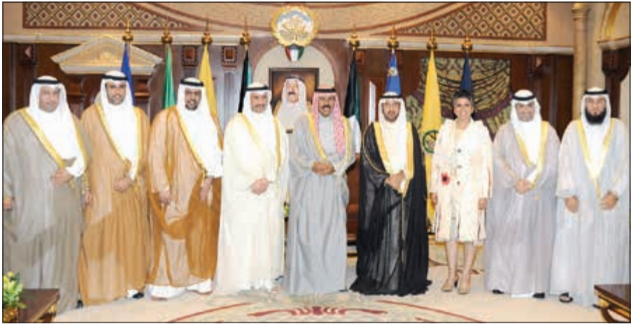
سمو ولي العهد الشيخ نواف الأحمد متوسطا الرئيس مرزوق الغانم وأعضاء الشعب البرلمانية