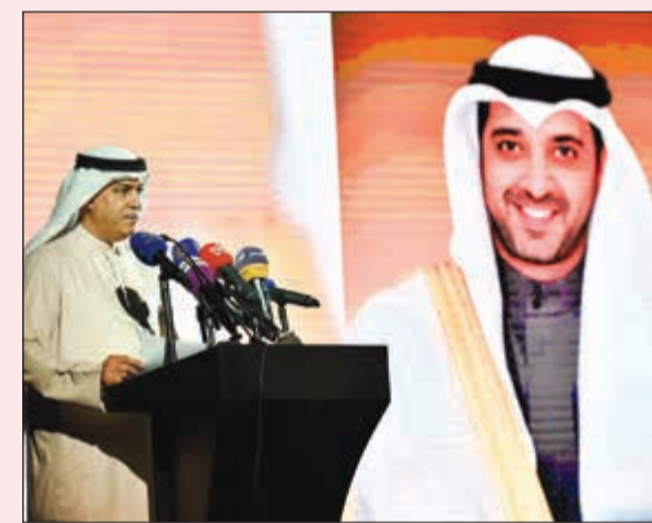
اليوحة يلقي كلمة راعي الحفل