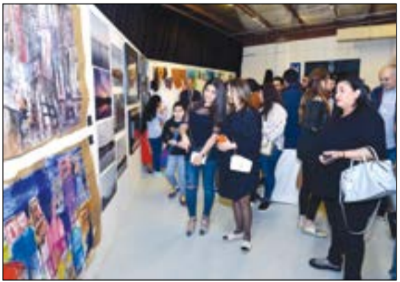
جولة في المعرض

الحضرات المتعددة. ونال هذا المعرض استحسان أولياء الأمور