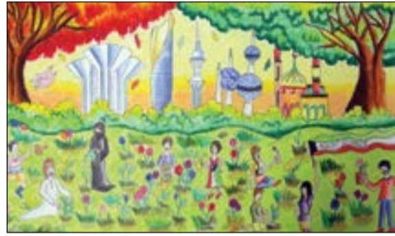
من اللوحات المشاركة في العام الماضي