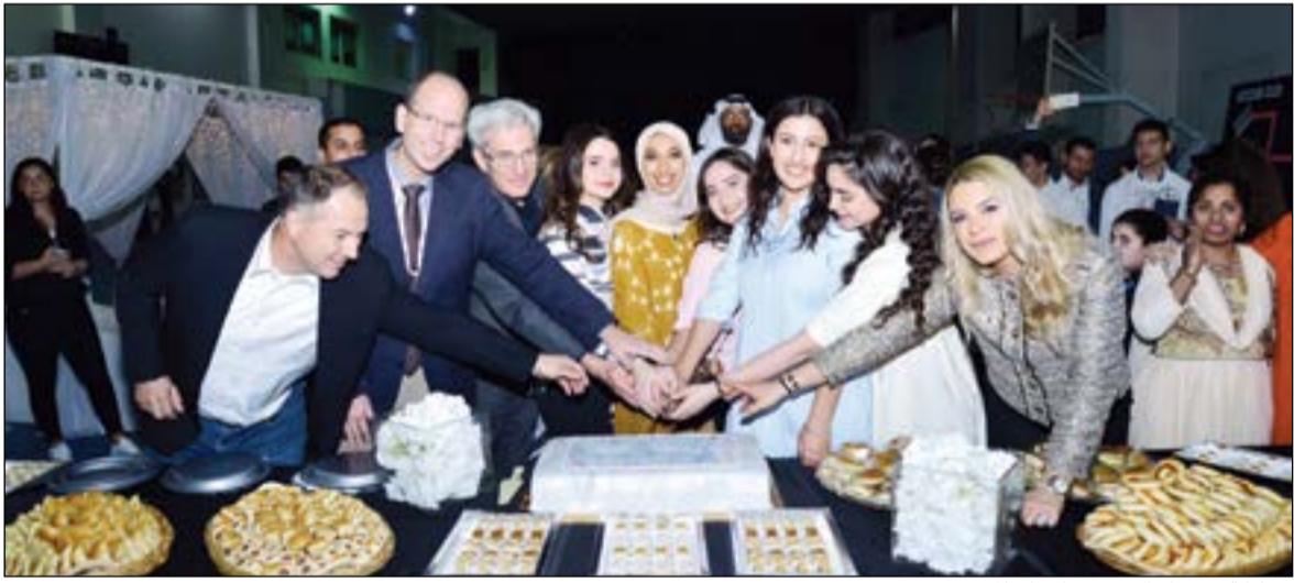
مشاركة في قطع كيك حفل افتتاح المعرض