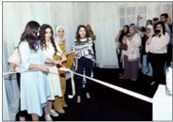
قص شريط افتتاح المعرض