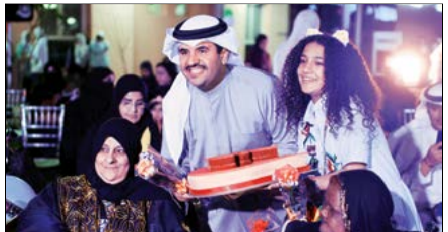
الشيخ دعيج الخليفة يحتفي مع «سابليه» بالأمهات في دور الرعاية