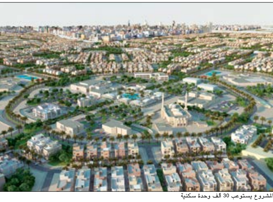
المشروع يستوعب 30 ألف وحدة سكنية