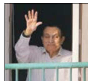
لقطة أرشيفية للرئيس الأسبق حسني مبارك وهو يحيي أتباعه من المستشفى

وكالات: تتطلع غداً أعضا أعمال اللجنة الوزارية المشتركة لمراقبة سوق النفط بمنظمة أوبك وتنتج الأنتظار بجميع الأوساط الاقتصادية في جميع أنحاء العالم إلى الكويت التي تستضيف اجتماعات اللجنة، حيث يتربح الجميع ما سينتج عن الاجتماع من تحديد مدى