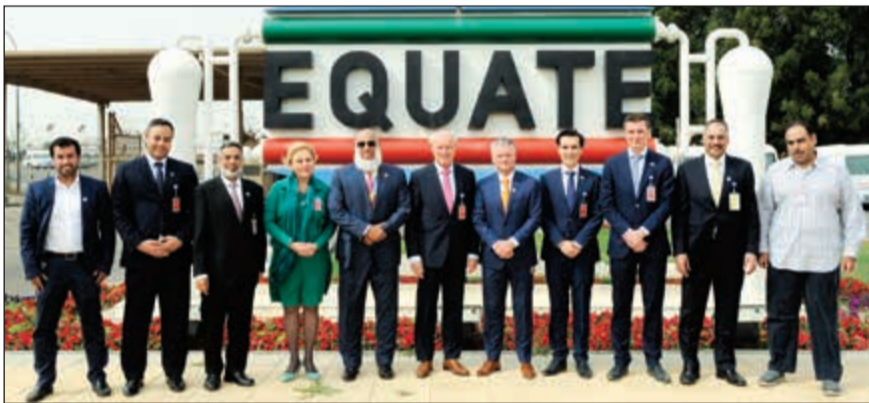
لقطة جماعية تضم وفد السفارة الهولندية وفريق الإدارة العليا في «إيكويت» خلال استقبالهم في مجمع إيكويت الصناعي

استضافت شركة إيكويت للبترولوكيمويات مؤخراً سفير مملكة هولندا لدى الكويت فرانس بوتوات، وذلك في مجمع إيكويت الصناعي بمنطقة الشعبية الصناعية بهدف توطيد العلاقات بين الشركة وهولندا، وعلى وجه الخصوص في الشؤون الصناعية والاقتصادية.