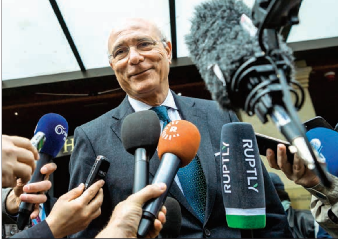
رمزي عز الدين رمزي نائب مبعوث الأمم المتحدة في سورية أثناء مؤتمر صحفي عقب اجتماعه مع المعارضة أمس (إ.أ.ب)

يذكر ان هذه الجولة من المباحثات تأتي بعد ثلاثة اسابيع من اختتام الجولة الرابعة والتي افضت الى وضع جدول أعمال يتضمن العمل بالتوازي على اربعة محاور، هي منظومة الحكم في سورية وصياغة دستور جديد وإجراء انتخابات تحت رعاية الأمم المتحدة ومحاربة الإرهاب.