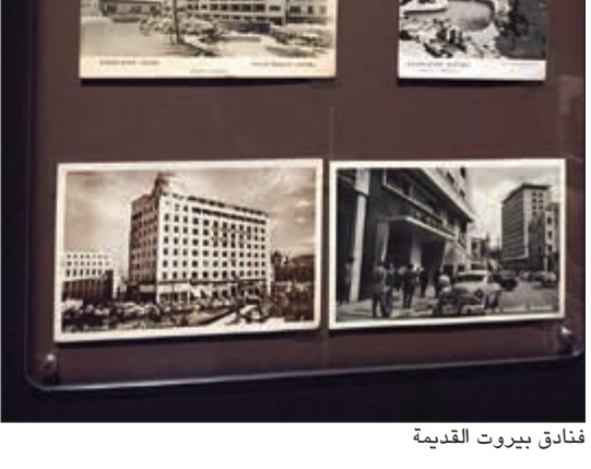
فنادق بيروت القديمة

ويصافى أن قانون الانتخاب والموازنة العامة وسلسلة رتب ورواتب مطروحة للحسم في شهر أبريل الموسم أول