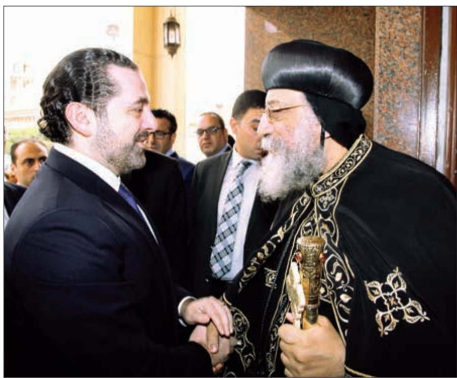
البابا تواضروس الثاني مستقبلا سعد الحريري

سعد الحريري في التوصل إلى توافق بين كل مكونات الشعب اللبناني، ومؤكدا دعم مصر الكامل لاستقرار السياسي في لبنان. كما رحب الرئيس بإنعقاد اللجنة المشتركة برئاسة رئيس وزراء البلدين والتي ستشهد توقيع عدد من الاتفاقيات ومذكرات التفاهم في مجالات التعاون المختلفة، وذلك في ضوء حرص الجانبين على الارتقاء بأطر التعاون القائمة لأفاق جديدة بما يحقق مصالح الشعيين الشقيقين. من جانبه، أعرب رئيس الوزراء اللبناني سعد الحريري عن تقديره لمكانة مصر في العالم العربي، مؤكدا قوة وعمق العلاقات بين البلدين، ومشيدا بمواقف مصر الثابتة من لبنان ودعمها لأمنه واستقراره. كما أكد حرص بلاده على تطوير العلاقات الاقتصادية والتجارية والسياحية مع مصر، وزيادة مستوى التبادل