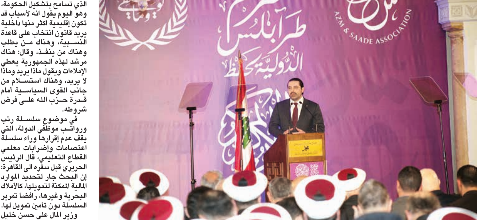
رئيس مجلس الوزراء سعد الحريري خلال افتتاح جائزة عزم الدولية لحفظ القرآن الكريم وتجويدِهِ في قاعة مسجد محمد الأمين في وسط بيروت

رئيسا للجمهورية وننتخب ميشال عون، وهذا المقرر هو الذي تسامح بتشكيل الحكومة، وهو اليوم يقول انه لأسباب قد تكون اقليمية أكثر منها داخلية يريد قانون انتخاب على قاعدة النسبية، وهناك من يطلب وهناك من ينفذ. وقال: هناك مرشد لهذه الجمهورية يعطي الاملاءات ويقول ماذا يريد وماذا لا يريد، وهناك استسلام من جانب القوى السياسية أمام قدرة حزب الله على فرض شروطه. في موضوع سلسلة رتب ورواتب موظفي الدولة، التي يصف عدم إقرارها وراء سلسلة اعتصامات واضرابات معلمي القطاع التعليمي، قال الرئيس الحريري قبل سفره الى القاهرة: إن البحث جار لتحديد الموارد المالية الممكنة لتمويلها، كالأماك البحرية وغيرها، رافضا تمرير السلسلة دون تأمين تمويل لها. وزير المال علي حسن خليل (أمل) شرح في مؤتمر صحفي أبرز الضرائب المعتمدة والتي لا تطول عموم الناس الذين من حقهم أن يصرخوا ويقلقوا لأن تجارها مع الدولة لم تكن مشجعة، وأشار إلى إمكانية إعادة النظر في الزيادة التي أدخلت على ضريبة القيمة المضافة (T.V.A). كما ألمح إلى إمكانية التراجع عن الطابع على الفواتير التي تمس الناس، وعن رسم المغادرة برا وجوا وحصر موضوع إجراء الانتخابات في موعدا، وتاجيل هذه الانتخابات ليس مهما، المهم ان تجري الانتخابات حتى بعد ستة اشهر او سنة. وردا على سؤال لـ «صوت لبنان»، قال سعيد: لا ادري اذا قبل الرئيس الحريري بالنسبية، إنما لا شك انه منذ انتخاب الرئيس ميشال عون هناك انطباع لدى اللبنانيين بأن هناك مقرا لإنهاء الدولة في لبنان وموجودا في مكان ما هو الذي يقول انتخبوا ميشال عون