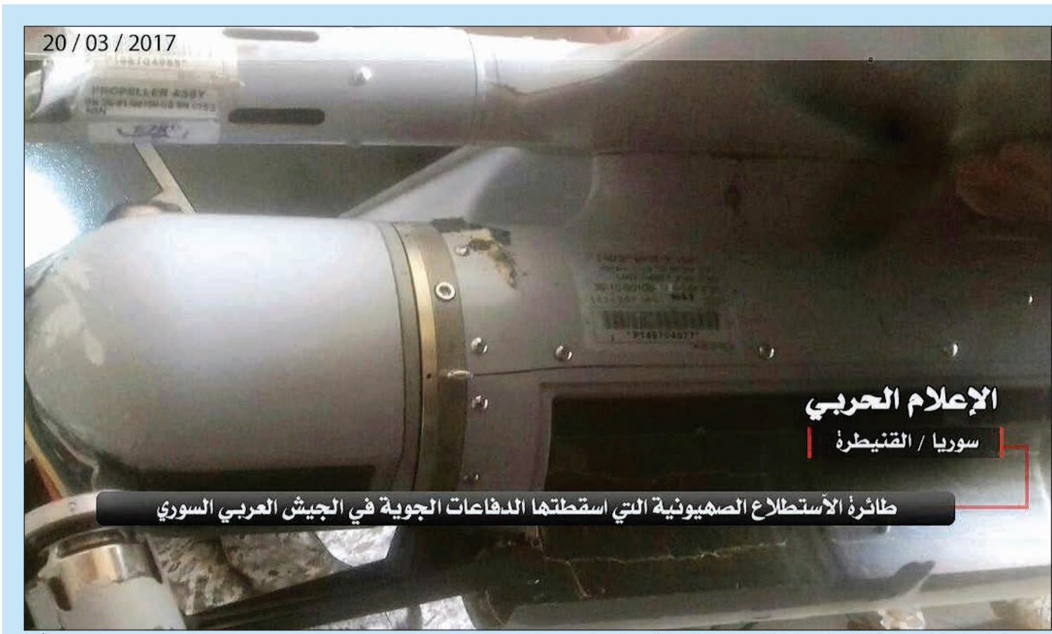
صورة بثتها وسائل إعلام سورية للطائرة الإسرائيلية التي أسقطتها سورية فوق القنيطرة

تتصدى لمحاولات تسلل مجموعات ارهابية من جبهة النصرة باتجاه منطقة المغازل شمال جوبر وتتمكّن من تطبيق المجموعات المتسللة وتقوم بتطهير المنطقة. وتنهسر الصواريخ المنطلقة من المناطق التي تسيطر عليها المعارضة والقصائل المقاتلة على احياء العباسيين والتجارة القريبة من حي جوبر ومن وسط العاصمة. وأفادت وكالة الأنباء السورية «سانا» بأن 12 شخصا أصيبوا بجروح جراء القصف الصاروخي. وتجددت المعارك قبل جولة جديدة من المفاوضات بين ممثلين عن النظام السوري والمعارضة من المقرر أن تبدأ غدا في جنيف برعاية الأمم المتحدة. وأعلنت الأمم المتحدة أمس ان وفدي الحكومة السورية والمعارضة اكدا حضورهما. وقال رئيس الوفد الحكومي بشار الجعفري في مقابلة ان «الهجمات الإرهابية الأخيرة في دمشق وغيرها في سورية تستهدف الضغط على الحكومة قبل جنيف». وبالتزامن مع هذه التطورات، قتل مدنيون وأصيب آخرون - بينهم أطفال ونساء - بجروح وذلك في غارات شنتها طائرات النظام على مدن وبلدات جسرين وحزما وعين ترما وعربين وحمورية وسقبا في الغوطة الشرقية بريف دمشق. وعلى جبهة أخرى، قالت المعارضة المسلحة في بيان إنها سيطرت على جبال الأفاعي وسهلة بشر الأفاعي في منطقة القلمون الشرقي بريف دمشق بعد معارك وصفت بالعنيفة مع تنظيم داعش. وأضاف بيان المعارضة أن المعارك في المنطقة انتهت بانسحاب التنظيم من تلك النقاط.