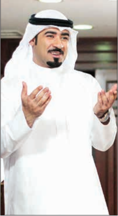
النجم بشار الشطي