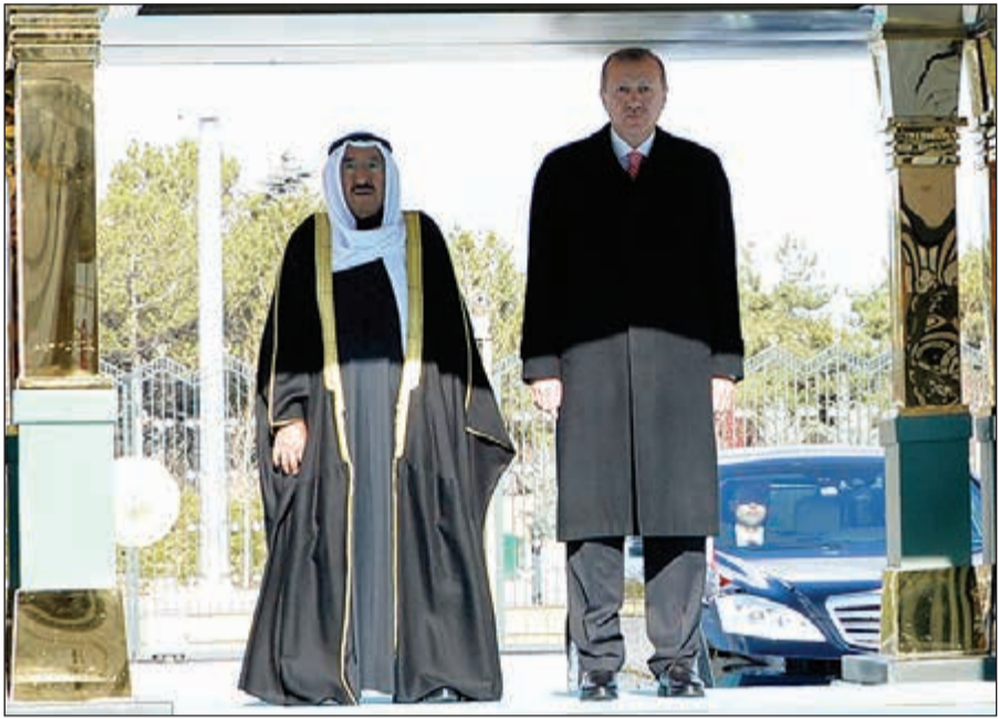
صاحب السمو الأمير الشيخ صباح الأحمد والرئيس التركي رجب طيب أردوغان خلال عزم السلام الوطني

انقرة - كونا: أقيمت عصر امس في القصر الرئاسي بالعاصمة أنقرة مراسم الاستقبال الرسمية لصاحب السمو الأمير الشيخ صباح الأحمد وذلك بمناسبة زيارة الدولة الرسمية.