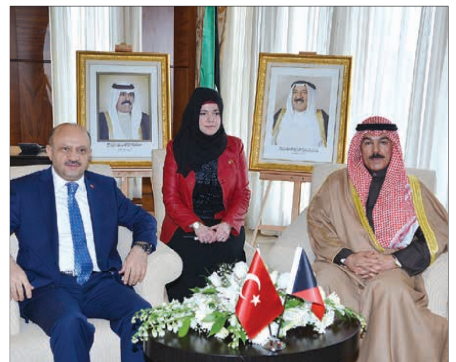
الشيخ محمد الخالد خلال اللقاء مع وزير الدفاع بجمهورية تركيا الصديقة فكري ايشق