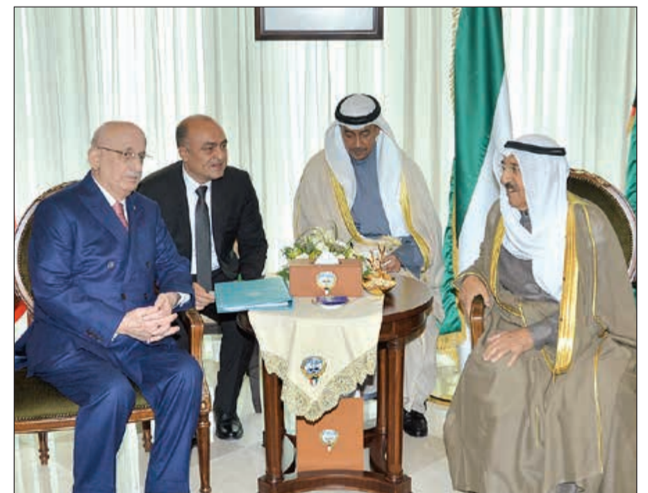
صاحب السمو الامير خلال لقائه مع رئيس البرلمان التركي اسماعيل كهرمان