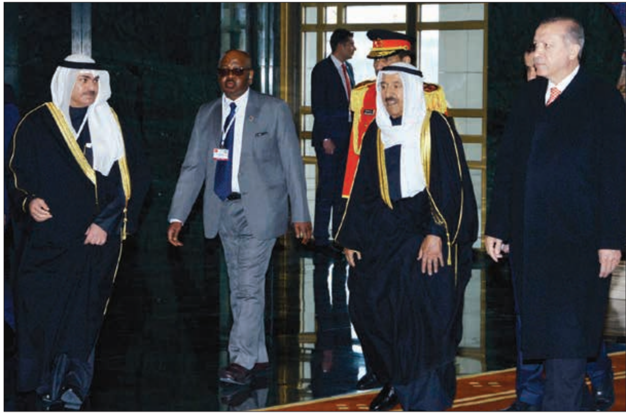
صاحب السمو الامير والرئيس رجب طيب اردوغان قبيل بدء المباحثات الرسمية

واغرب في هذا السياق عن بالغ ترحيبه بهذا التعاون مضيفا ان المعنيين والمختصين بهذا الجانب وكذلك القطاع الخاص من كلا البلدين سيتم تشجيعهم لتفعيل هذه الشراكة لما لها من مصلحة لكلا البلدين الصديقين. ووضح ان الجانبين تناولوا كذلك السبل والخطوات التي سيتخذها الجانبان في سبيل تفعيل العلاقة الاقتصادية ما بين البلدين لترقي الي «المنازاة» التي تربط البلدين.