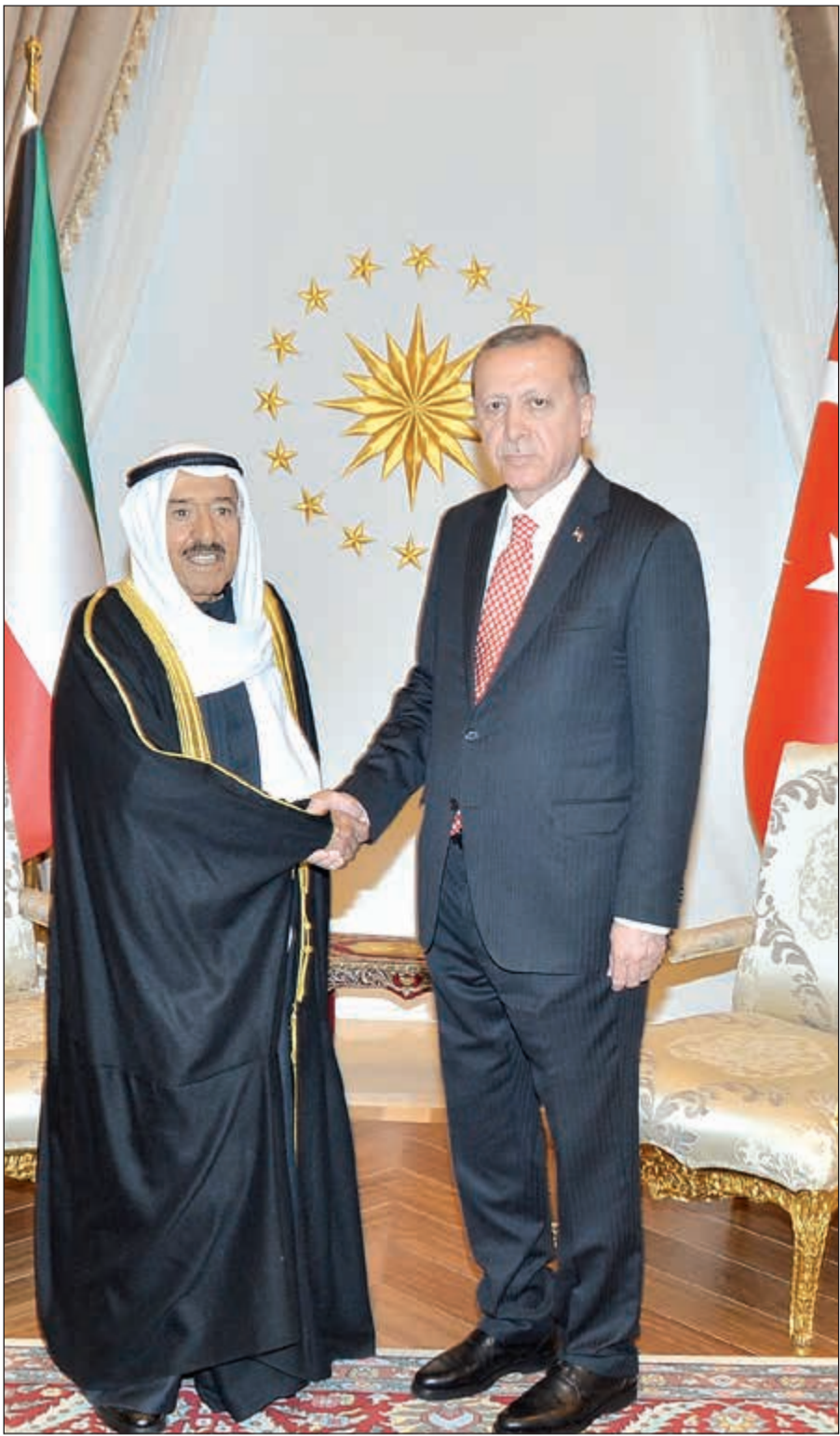
صاحب السمو الامير خلال المباحثات الرسمية مع الرئيس التركي