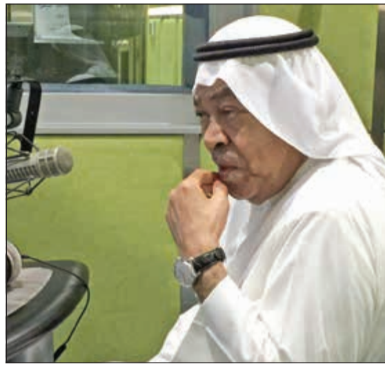
الفنان الكبير سعد الفرج