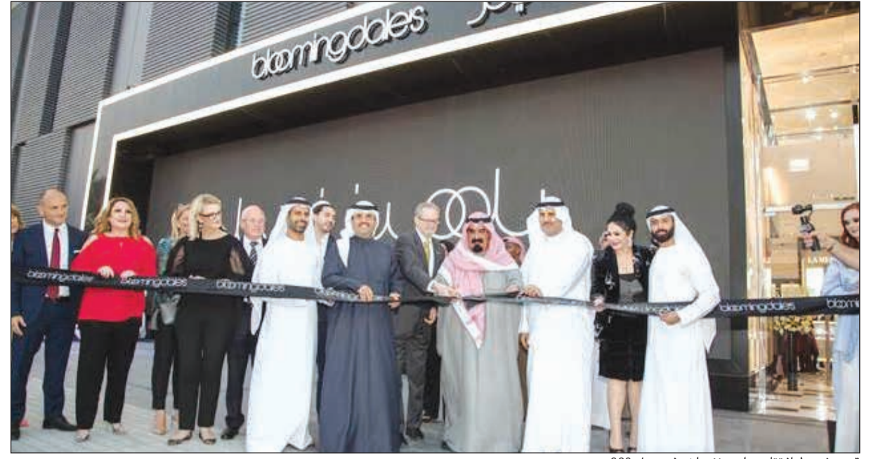
قصر شريط افتتاح «بلومينغديلز» في مول 360