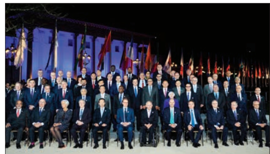
لقطة تجمع وزراء مالية مجموعة الـ20 ومحافظي البنوك المركزية وكريستين لاغارد في بادن بادن

بادن بادن - وكالات: قال اقتصاديون: إن إخفاق مسؤولين ماليين من حول العالم في الاتفاق على مقاومة الحماية التجارية ودعم التجارة الحرة يمثل انتكاسة لمجموعة العشرين ويهدد نمو الاقتصادات التي تعتمد على التصدير مثل ألمانيا التي استضافت اجتماع المجموعة. وإذعانا لتنامي النزعة الحمائية الأميركية، تخلى وزراء المالية ومحافظو البنوك المركزية من أكبر عشرين اقتصاداً في العالم في اجتماعهم بمدينة بادن بادن الألمانية عن التمسك بالحفاظ على حرية التجارة العالمية.