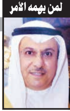
لمن يهيمه الأمر

ما رأيته من كويت جديدة تبنى ذكرني بحقيقة عشتها في طفولتي ومطلع شبابي أو هو عقد من عشر سنوات بدل