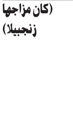
كان مزاجها زنجبيلاً