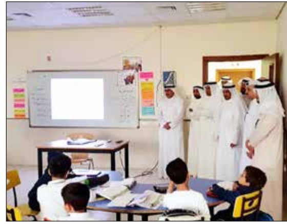
الفارس في أحد الفصول التعليمية