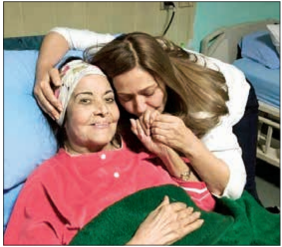
مديحة يسري في المستشفى

نوفمبر الماضي بعد صراع مع المرض، حيث كان يعاني من السرطان، وتغيبت الفنانة ليلى علوي عن العزاء بسبب ظروفها الصحية.