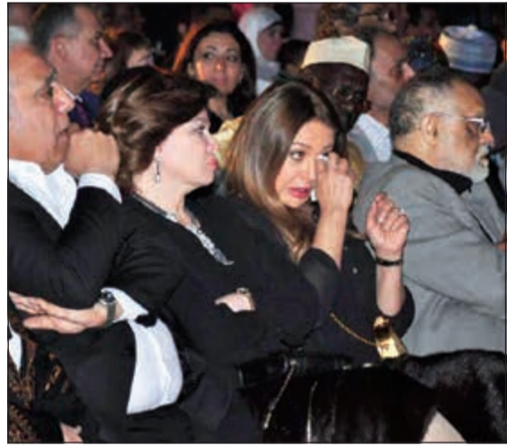
ليلى علوي تبكي