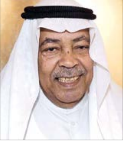
الفنان القدير سعد الفرج