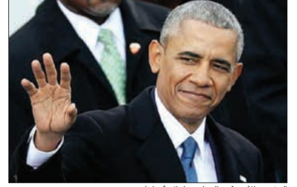
الرئيس الأمريكي السابق باراك أوباما

باريس - وكالات: وصل الرئيس الأمريكي السابق باراك أوباما، الخميس، إلى بولينزيا الفرنسية، حيث يمكن أن يمضي شهرا، كما ذكرت قناة التلفزيون المحلية. ووصل أوباما الذي لا ترافقه عائلته، إلى تاهيتي أولا، قبل أن يتوجه بعد دقائق إلى جزر نيتياورا المرجانية. وسيقدم أوباما في براندو الفندق الفخم في هذه المنطقة التي جذبت إليها من قبل النجم الأمريكي مارلون براندو. ويعرض فندق «ذي براندو» قبالا بأسعار تتراوح بين ألفين و12 ألفا و300 يورو لليلة الواحدة لمن يرغب في الإقامة ثلاث ليال على الأقل. وسيصور أوباما جزرا أخرى في الأرخبيل الذي يتألف من 118 جزيرة. ولم يعلن عن أي لقاء سياسي خلال هذه الزيارة.