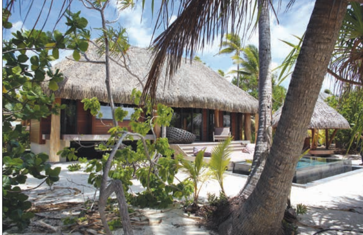
فندق براندو الذي سيقدم فيه أوباما