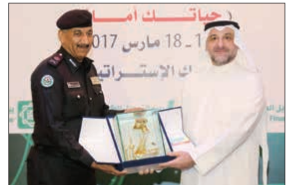
اللواء فهد الشويع يتسلم درعاً تذكارية من بيت التمويل الكويتي