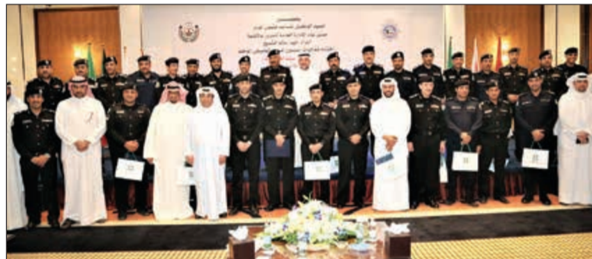
... ومتوسطا المكرمين من الضباط والصحافيين