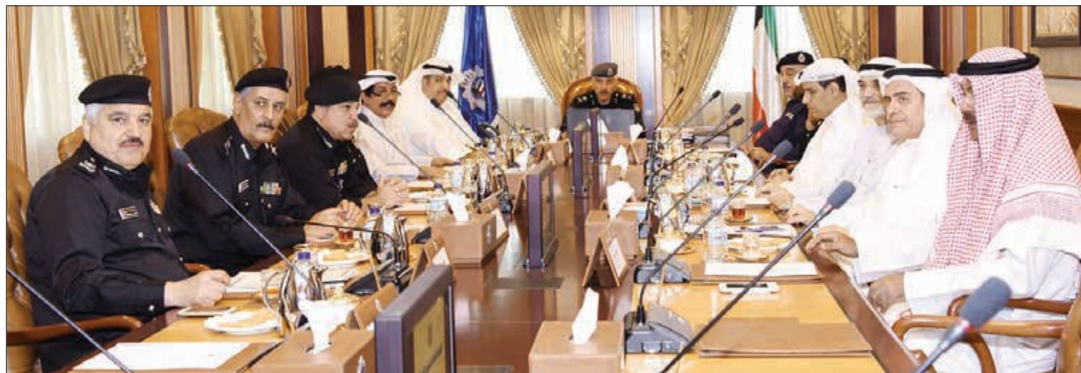
اللواء محمود الدوسري خلال ترؤسه لاجتماع اللجنة العامة لشؤون الشرطة بحضور وكلاء الداخلية المساعدين