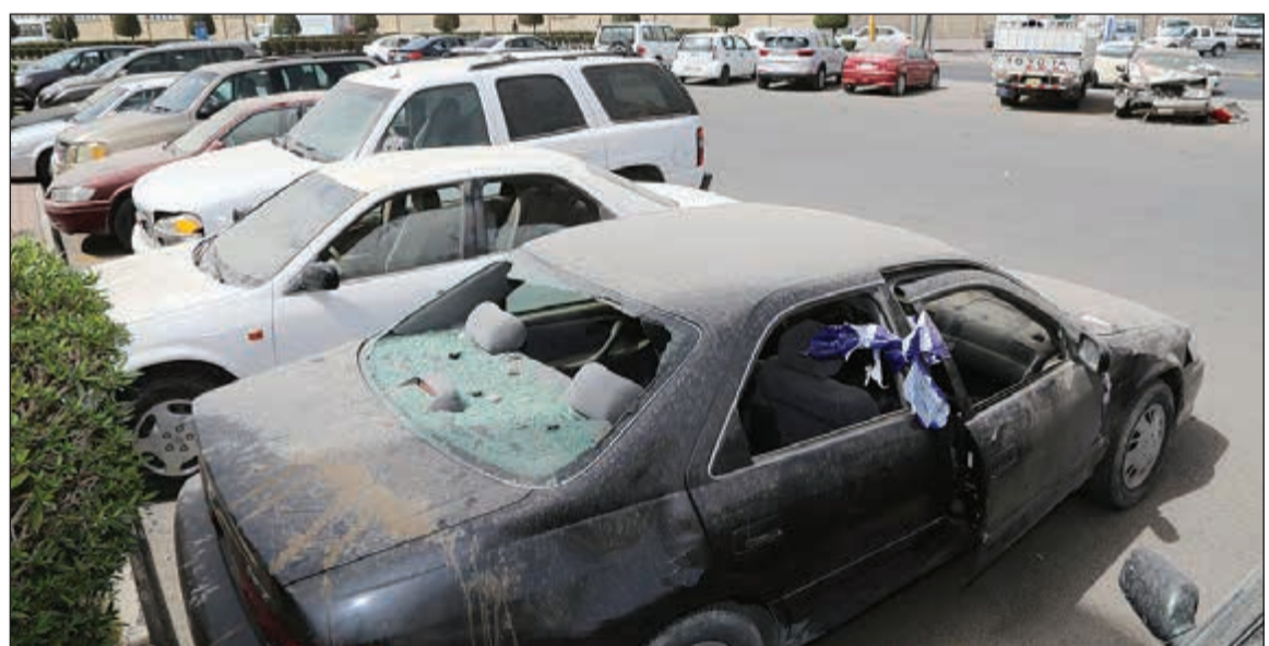
بعض من المركبات التي سرقتها التشكيل العصابي في إحدى الساحات