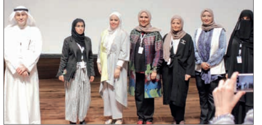
جانبا من المشاركين في مهرجان «عدسة» الثاني