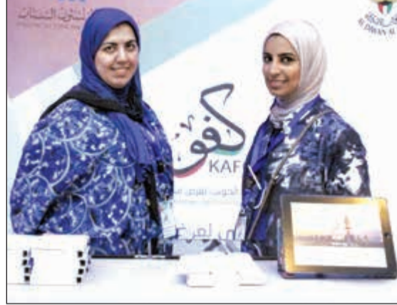
مشاركاتان بمهرجان «عدسة» الثاني

ورداً على سؤال حول مشروع مطار الكويت الدولي «2»، أوضح المطوع أن المشروع يسير وفق برنامج الزماني، وهناك العديد من اللقاءات بين وزارة الأشغال ومآل المشروع من أجل