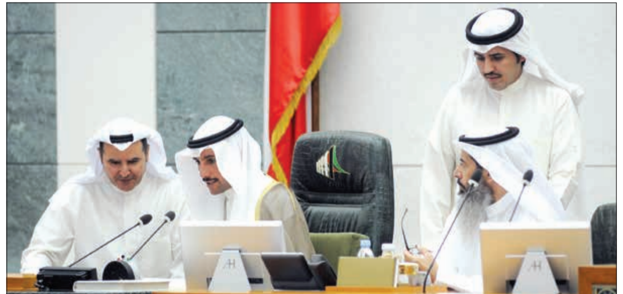
رئيس مجلس الأمة مرزوق الغانم وعصام المرزوق ونايف المرداس وناصر الدوسري على المنصة

توضيح الأمر. ● وزير التجارة: تكلما عن قانون الرياضة وقانون الرياضة داخل اللجنة البرلمانية وهناك تعاون مع اللجنة، ولا يمكن ان نعد قبل لا نملك ونمد يد التعاون مع اللجنة والقانون موجود عندها، والمنصة موجودة وحياه الله. ● صالح عاشور: بالنسبة للمنصة حياك الله اذا ما جاوبت عن الأسئلة ولا خيار آخر أمامي إلا المنصة.