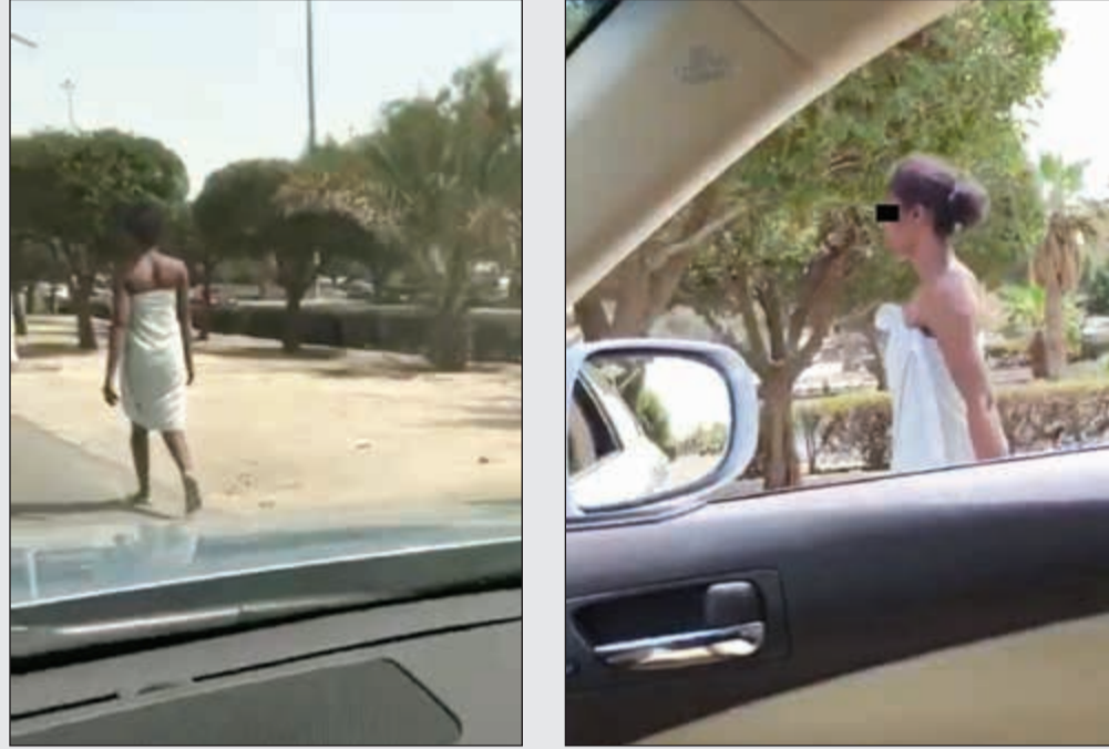
الأفريقية بالمنشفة ودون حذاء

نقل رجال الاسعاف وافدة أفريقية تم رصدها من قبل مواطنة تقوم بالسير على القدمين في ممشى النزهة وقد غطت جزءاً من جسدها بمنشفة، وقال مصدر أمني إن بلاغاً ورد من مواطنة تفيد بوجود امرأة أفريقية تسير دون حذاء وبمنشفة وضعتها على جزء من جسدها في ممشى النزهة، وعليه توجه رجال الأمن والاسعاف واتضح أن الوافدة من الجنسية الأفريقية (مدغشقر) وهي مهزوزة وتعاني من مرض نفسي وتم نقلها إلى المستشفى. وأضاف المصدر أن المواطنة التي قامت بإبلاغ العمليات وتقت الواقعة بتصوير فيديو انتشر بشكل كبير عبر مواقع التواصل الاجتماعي. إلى ذلك قال مصدر أمني لـ «الأنباء» أن إدارة العمالة المنزلية بصد استدعاء صاحب المكتب الذي استقدمها بهدف التحقيق ومعرفة ما إذا كان على علم باصطحابها نفسياً.