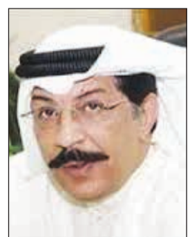
اللواء عبد الحميد العوضي

بناء على أمر وكيل وزارة الداخلية المساعد لشؤون الأمن الجنائي اللواء عبدالحاميد العوضي، أحيل إلى نيابة المخدرات يوم أمس مواطن يعمل موظفاً في جهة حكومية وعسكري سابق في وزارة التحريات اللازمة على خلفية الاتجار في المواد المخدرة «الهيروين»، وأرفق