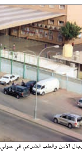
رجال الأمن والطب الشرعي في حولي حيث تم العثور على الجثة

أحيلت جثة شخصين، الأول آسيوي والثاني مواطن إلى الطب الشرعي بعد أن تم العثور على الأول داخل سيارة في حولي وتبين أن الجثة أوشكت على التحلل، والمواطن عثر عليه داخل منزله. وبحسب مصدر أمني فإن عمليات الداخلية تلقت بلاغاً بوجود جثة شخص داخل سيارة متوقفة مقابل إحدى المدارس وتبين أن الجثة أوشكت على التحلل. من جهة أخرى، نقلت جثة مواطن من منزله بمنطقة المهبولة إلى الطب الشرعي.