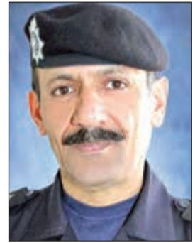
اللواء وليد الصالح

أبلغ مصدر أمني «الأنباء» بيان إدارة أمن المطار وخلال الشهر الماضي منعت سفر 165 شخصاً إلى خارج الكويت وألقت القبض عليهم وأحالتهم إلى الاختصاص نظراً لصدور أمر بمنعهم من السفر وتوقيفهم. وبحسب الإحصائية التي حصلت عليها «الأنباء» فإن أجهزة كشف المبعدين أدت إلى توقيف 48 وافداً حاولوا الدخول إلى الكويت رغم أن اسماءهم مدرجة في قوائم منع دخولها، فيما تم ضبط 5 وافدين حاولوا الدخول بجوازات سفر تخص غيرهم وهؤلاء تمت إحالتهم إلى النيابة بنهم متعلقة بالتزوير في محررات رسمية والشروع