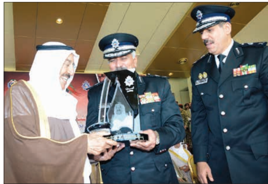
صاحب سمو الأمير الشيخ صباح الأحمد يتسلم درعاً تذكارية من وكيل وزارة الداخلية بالإنابة اللواء محمود الدوسري ويبدو اللواء الشيخ فيصل النواف