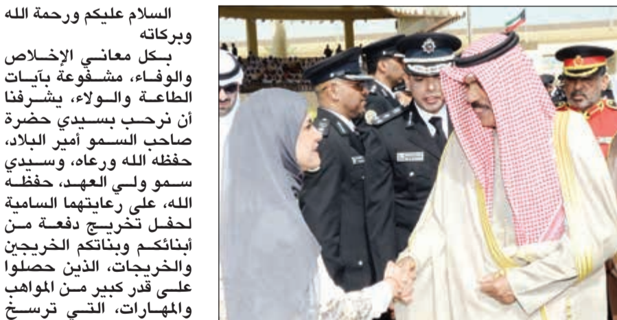
سمو ولي العهد يصافح إحدى السيدات

مجلس الوزراء، حفظه الله معالي الوزراء المحترمين أهالي الخريجين والخريجات الحضور الكريم