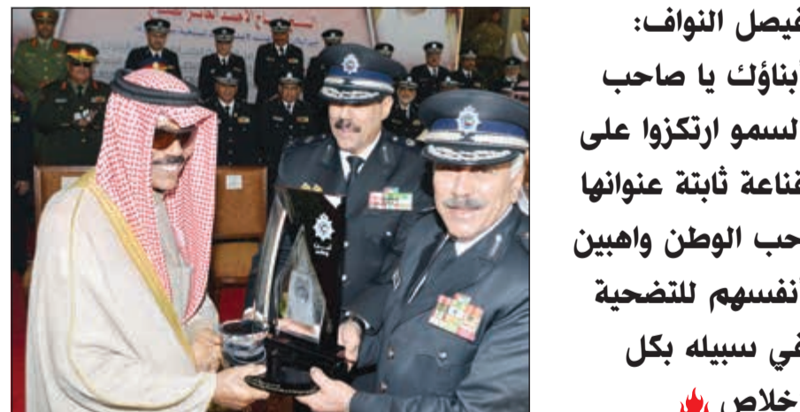
سمو ولي العهد يتسلم درعاً تذكارية من اللواء محمود الدوسري

للوقوات المسلحة الشيخ صباح الأحمد الجابر الصباح، حفظكم الله ورعاكم سيدي سمو ولي العهد