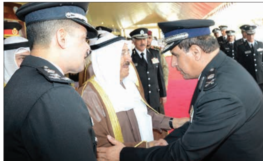
صاحب السمو الأمير الشيخ صباح الأحمد يصافح اللواء عصام النهام