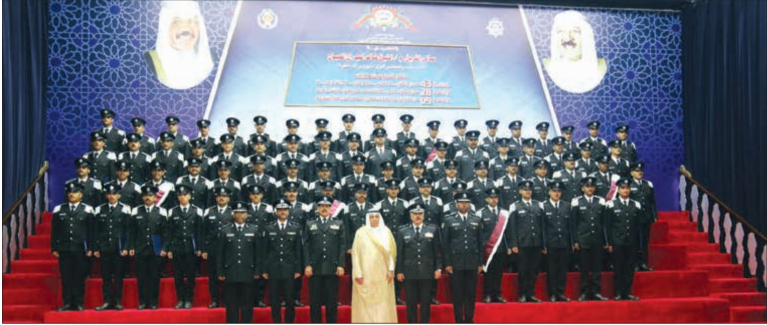
نائب رئيس مجلس الوزراء وزير الداخلية الفريق م. الشيخ خالد الجراح في لقطة تذكارية مع خريجي أكاديمية سعد العبدالله للعلوم الأمنية

• حضر صاحب السمو إلى حفل التخرج في تمام الساعة الـ 10,20 صباح امس. • توافد الإعلاميون من الصحافيين والمصورين في تمام الساعة الـ 6 صباحا إلى مواقف هيئة الشباب والرياضة وتم الانتقال في الساعة الـ 7. • عدد كبير من أهالي المتفوقين والخريجين توافدوا على مدخل إحدى بوابات أكاديمية سعد العبدالله وتم منع الكثير منهم لعدم توافر أماكن مخصصة لتواجدهم في المدرجات التي اكتظت بالزوار وأهالي الخريجين. • كان الانتشار الأمني لرجال الأمن في أنحاء الأكاديمية يدل على الترتيب المسبق والتنظيم الرائع للقائمين على الحفل إلا أن هناك واقعة حصلت وهي نزول الأهالي إلى أبنائهم من المدرجات بعد انتهاء الفقرات. • رغم انتهاء الفقرات إلا أن العسكريين ظلوا واقفين إلى أن بدأت الساحة الميدانية تخلو من الزوار وأهالي الطلبة الخريجين. • الحشاش ابدع في عملية إلقاء الخطاب وتناغم مع طيلات الموسيقى العسكرية التي أعطت أجواء جميلة استمتع بها الحضور.