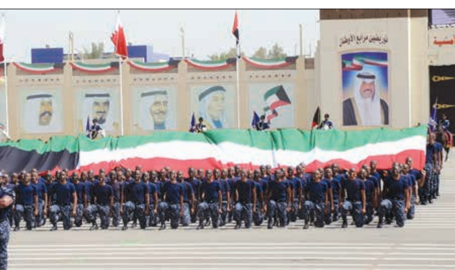
عروض قتالية أجريت على هامش حفل التخرج

مجلس الوزراء، حفظه الله معالي الوزراء المحترمين أهالي الخريجين والخريجات الحضور الكريم