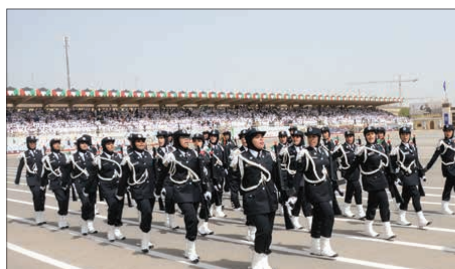
من طابور العرض

للوقوات المسلحة الشيخ صباح الأحمد الجابر الصباح، حفظكم الله ورعاكم سيدي سمو ولي العهد