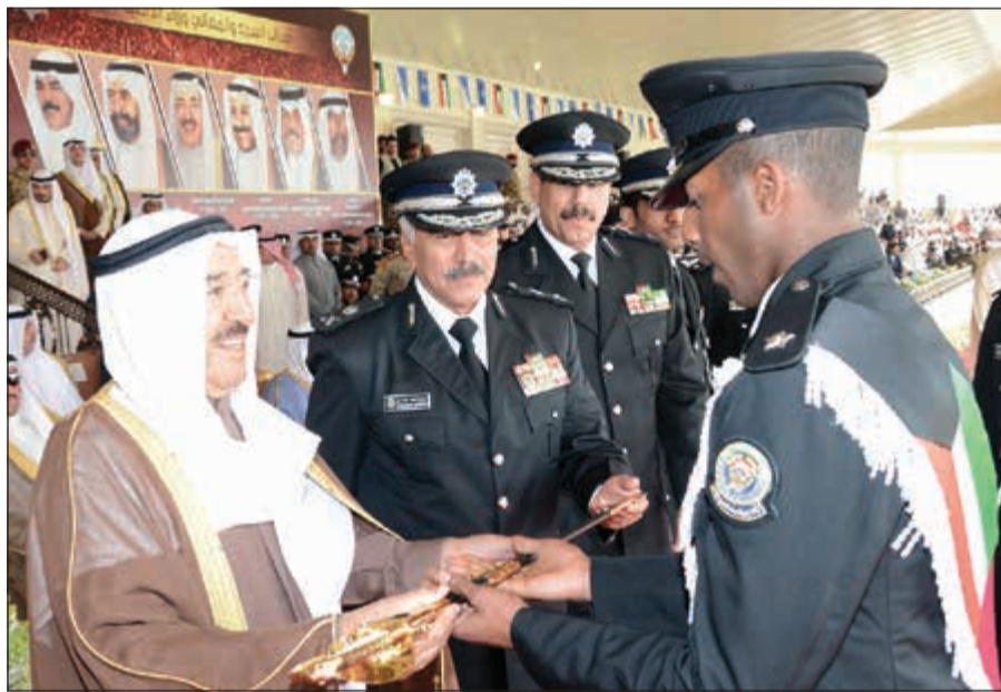
سمو الأمير يتسلم سيف التفوق من أحد الخريجين

وقد غادر سموه مكان الحفل يمثل ما استقبل به من حفاوة وترحيب.