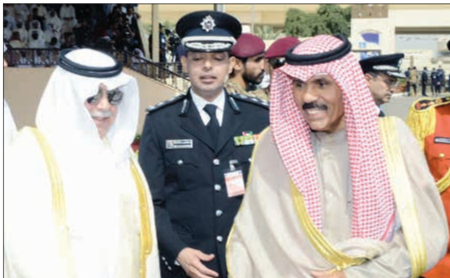
سمو ولي العهد الشيخ نواف الأحمد لدى وصوله الأكاديمية وفي مقدمة مستقبلي سموه الفريق م. سليمان الفهد