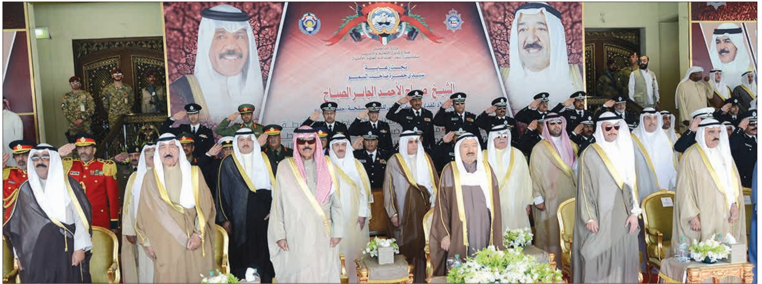
صاحب السمو الأمير الشيخ صباح الأحمد متوسماً سمو ولي العهد الشيخ نواف الأحمد ورئيس مجلس الأمة مرزوق الغانم والشيخ جابر العبدالله والشيخ فيصل السعود ونائب رئيس الحرس الوطني الشيخ مشعل الأحمد وكبار الحضور