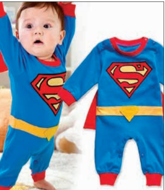
طفل بملابس سوبرمان

وحسب «دنيا الوطن» ذكر موقع 24 أفضل الألعاب التي تساعد الطفل على تنمية خياله وهي: الفياض: فمن أفضل الألعاب عند بلوغ الطفل سنتين ارتداء الأزياء، مثل زي السوبرمان، وراقصة البالايه، وشخصيات الكرتون، وغير ذلك من الأزياء التي تجعل الطفل يتخيل نفسه شخصية أخرى، وتساعد على إجراء محادثات تقوي مهاراته اللغوية والاجتماعية. ضوء أحمر ضوء أخضر: وتدعم هذه اللعبة قدرات ضبط النفس لدى الطفل، والتي يحتاجها في هذه المرحلة لأنه يتدفع بسبب