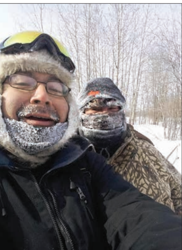
كنديان يتفحان ملابس ثقيلة لمواجهة الصقيع