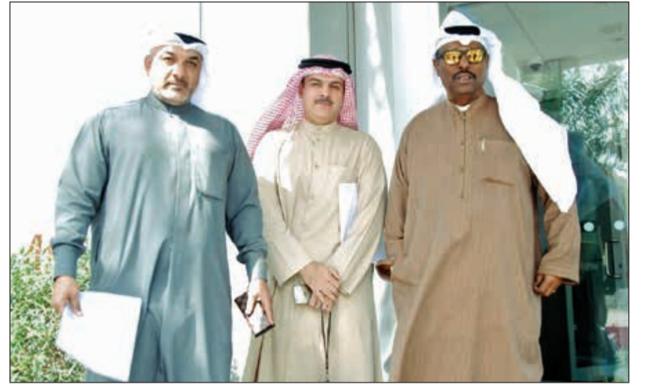
ممثلو تكتل المتضررين

قيمت شركة «كامكو» للاستثمار» سهم شركة هيومن سوفت القابضة - التي تعمل مباشرة على مجال التعليم الخاص في الكويت - بإداء «متفوق» على أساس سعر مستهدف 3,42 دنانير، والذي يعتبر أعلى بنسبة 13,3٪ من سعر إغلاق السهم عند 3,02 دنانير. وترتكز النظرة الإيجابية لهذا الاستثمار على المعطيات الأساسية لقطاع التعليم، والتي ما زالت قوية، حيث يعزى الطلب المستقبلي للتعليم العالي لازدياد عدد السكان للشباب والدعم الحكومي للتعليم العالي إلى جانب فجوة الكفاءات ضمن قطاع الشركات. ومن منظور التحليل الأساسي، فإن قوة أرباح الشركة واستدامة التدفقات النقدية وارتفاع الهوامش التشغيلية تعد في مجملها عوامل إيجابية، وقد شهد السهم إقبالا ملحوظا خلال العام 2016 ومنذ بداية العام 2017 حتى تاريخه (+11,9٪)، بما دفع بسعر السهم لارتفاع بشدة، إلا أنه رغمًا عن ذلك، ومع الإخذ في الاعتبار العوامل الرئيسية الدافعة للقطاع والتركيز الاستراتيجي للشركة وغياب منافسة أي شركات كبرى مماثلة في مجال التعليم الخليجي، نرى إمكانية تحقيق مزيد من الارتفاع في سعر السهم مستقبلياً. وتوقع تقرير «كامكو» أن يرتفع التعداد السكاني في الكويت للفترة العمرية ما بين 15 و19 عاماً بمعدل نمو سنوي مركب 3,2٪ خلال الفترة ما بين 2016 و2020 وفقاً لإحصائيات السكنية للأمم المتحدة. علاوة على ذلك، فإنه وفقاً لتوقعاتنا فإن خريجي المدارس الثانوية